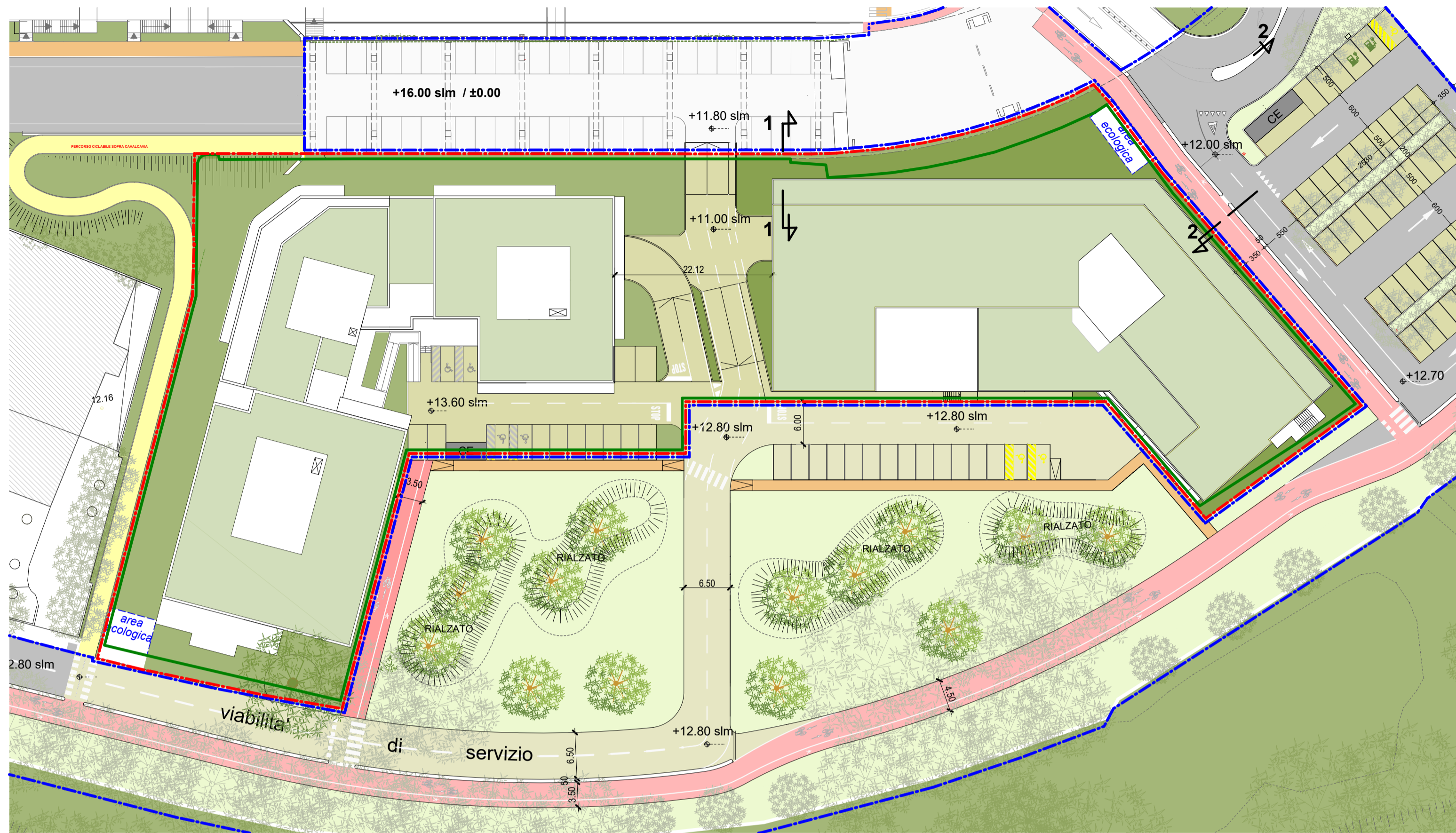
PLANIMETRIA GENERALE scala 1:500