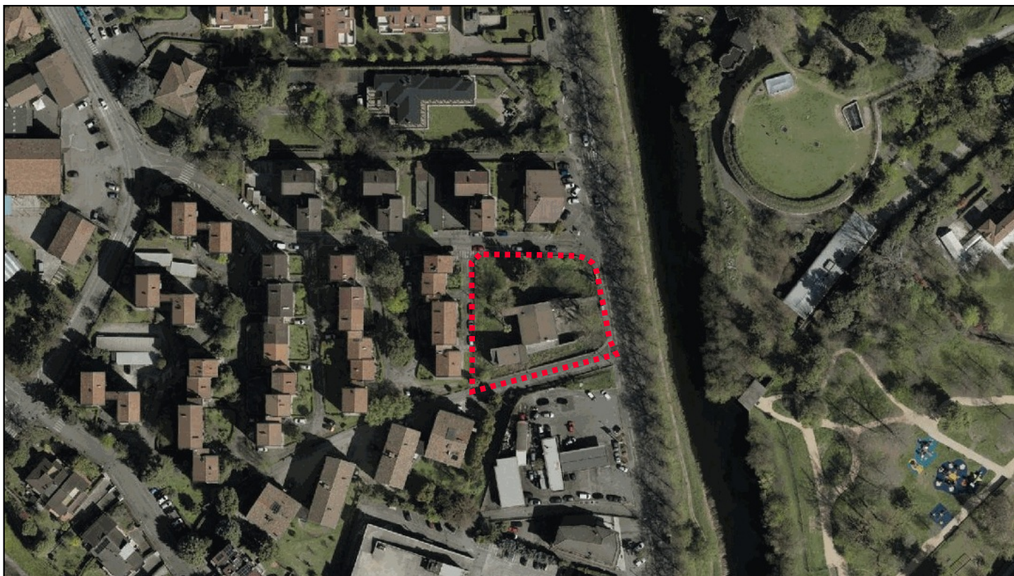
ESTRATTO ORTOFOTO (anno 2023) via Salerno