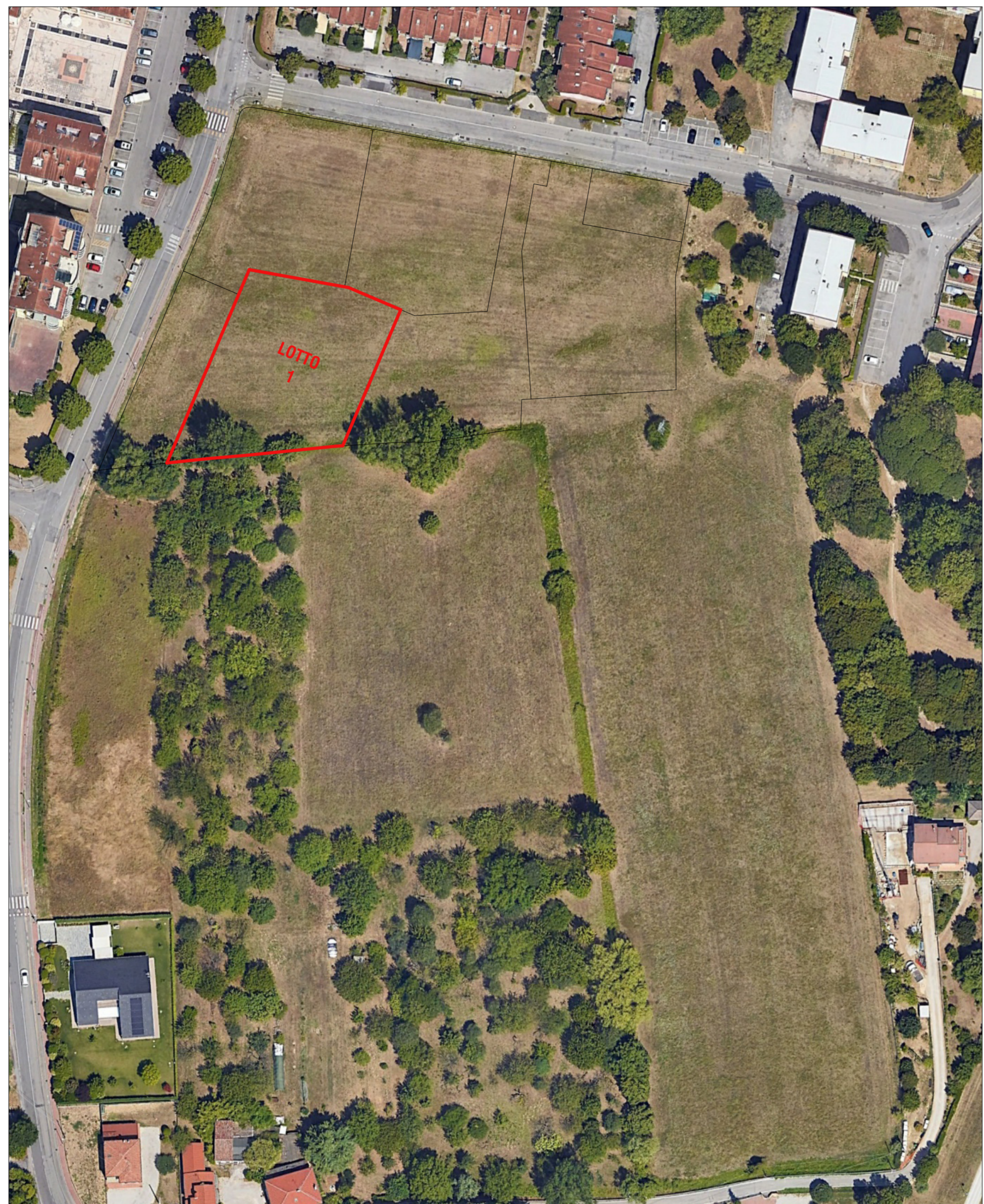
FOTOPIANO SCALA 1:1000