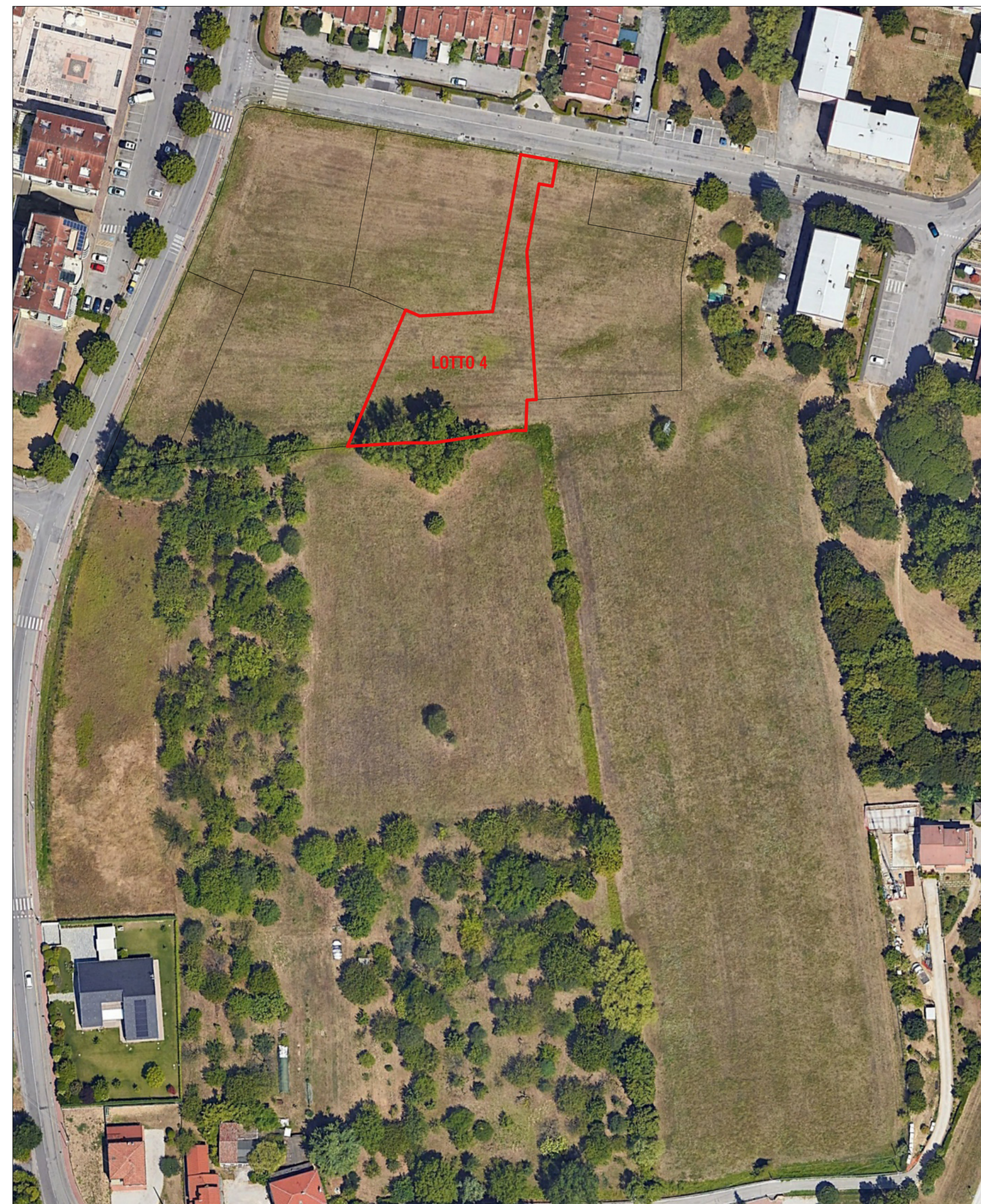
FOTOPIANO SCALA 1:1000