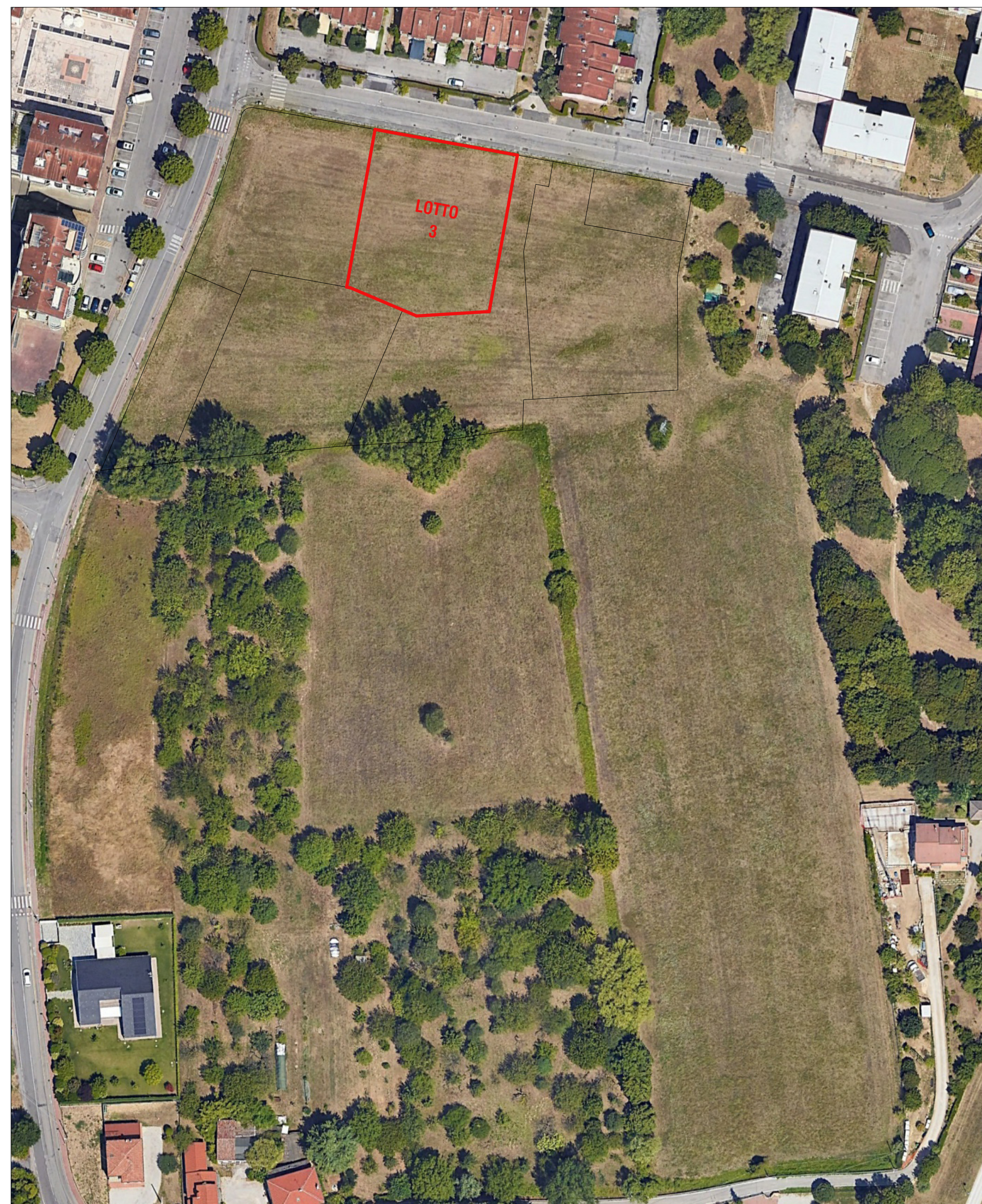
FOTOPIANO SCALA 1:1000