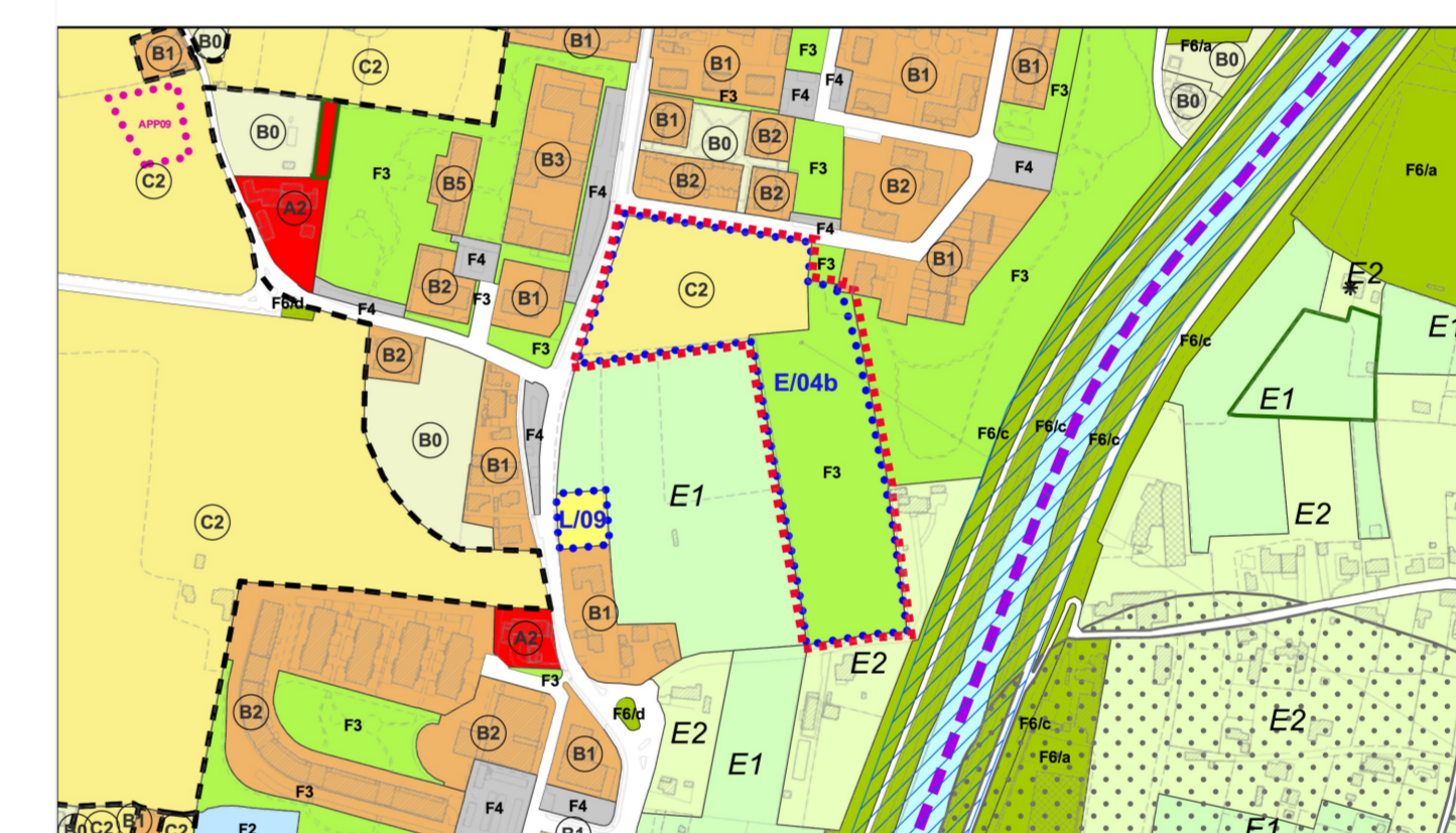
ESTRATTO P.I. variante Via E. Zacconi - via G. Boccacchio 1:5.000