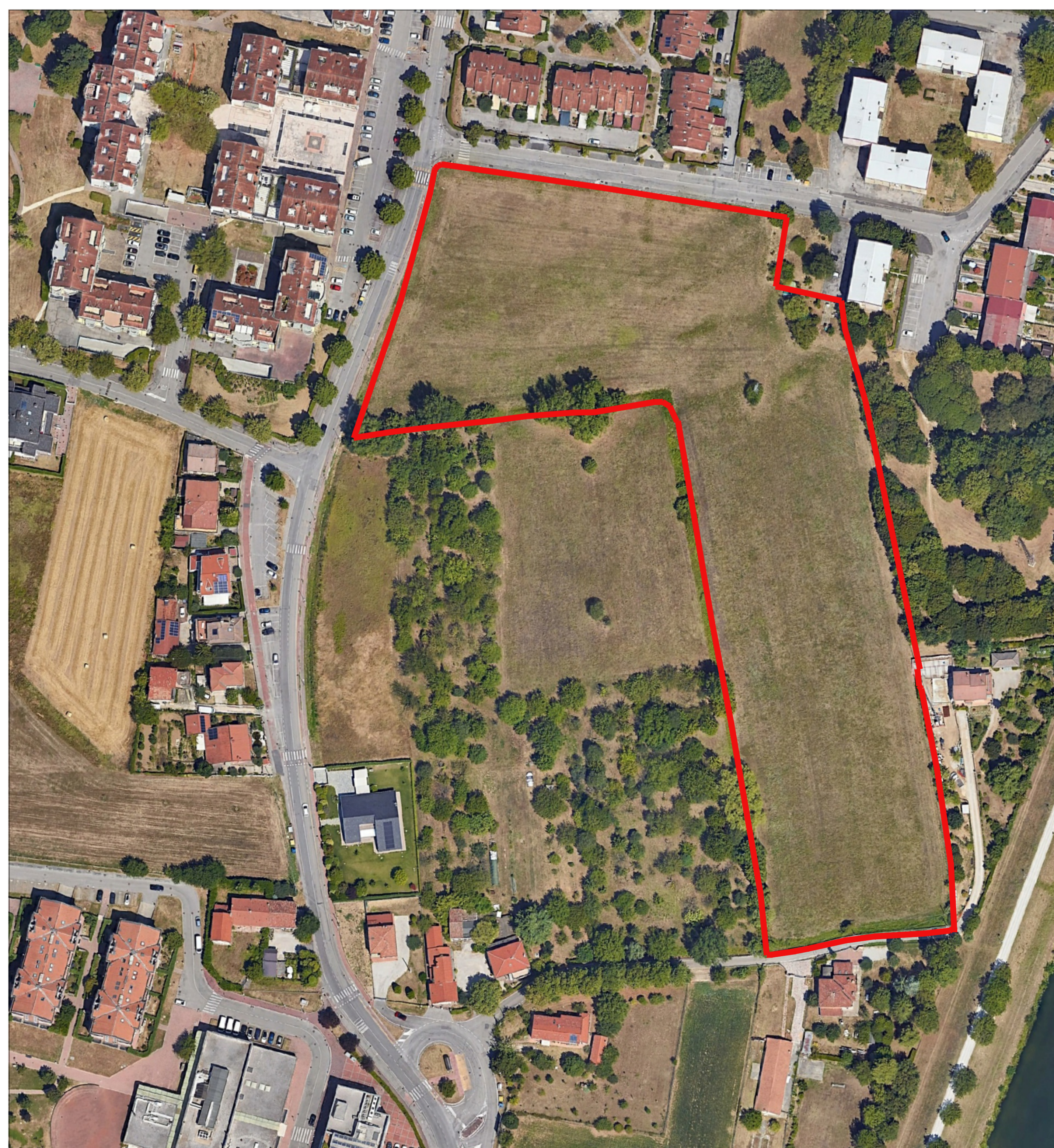
FOTOPIANO SCALA 1:1000