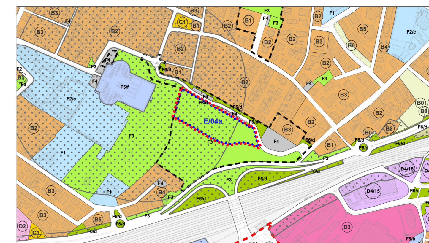
ESTRATTO P.I. variante via E. Rubaltelli - PUA "Parco Milcovich" 1:5.000