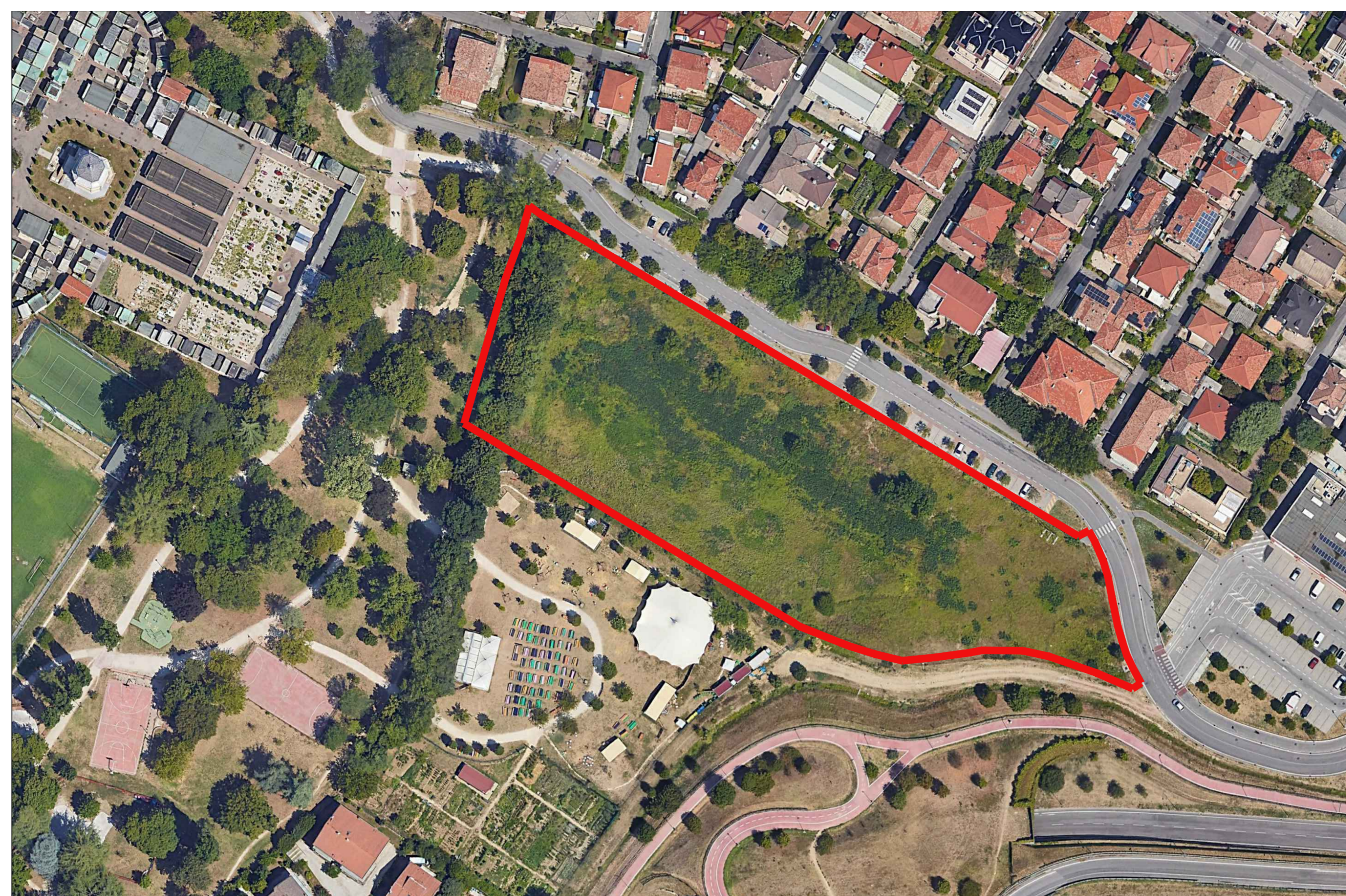
FOTOPIANO SCALA 1:1000