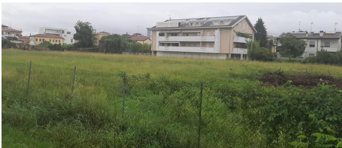
2 - Padova, quartiere San Giuseppe - vista verso nord-est