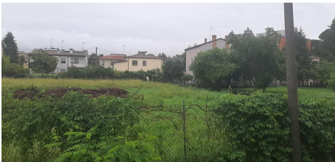
3 - Padova, quartiere San Giuseppe - Vista verso sud-est