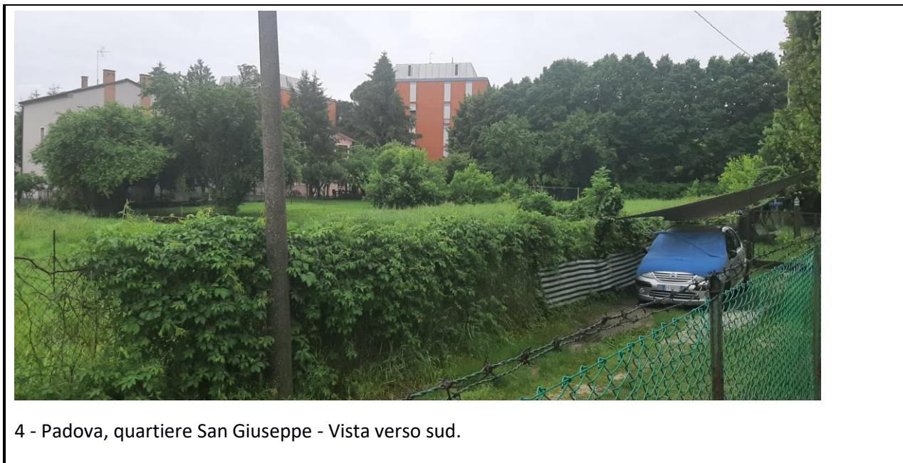
4 - Padova, quartiere San Giuseppe - Vista verso sud.