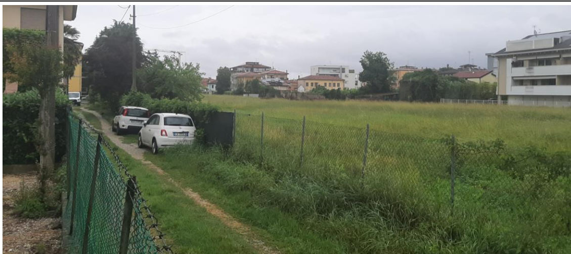
1 - Padova, quartiere San Giuseppe - vista verso nord