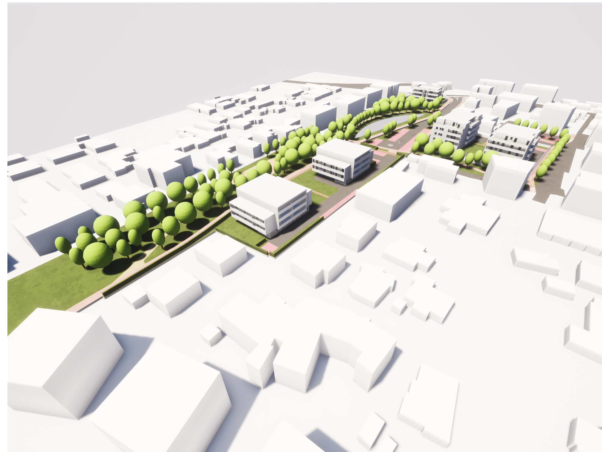
VISTA VERSO NORD OVEST 1