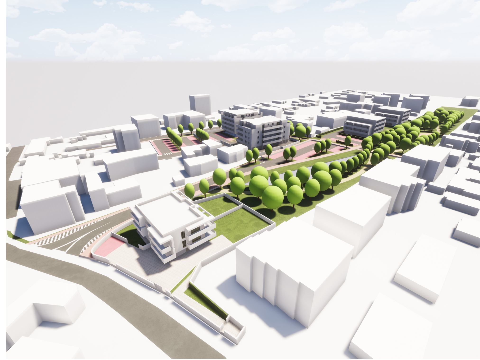
VISTA VERSO SUD EST 1