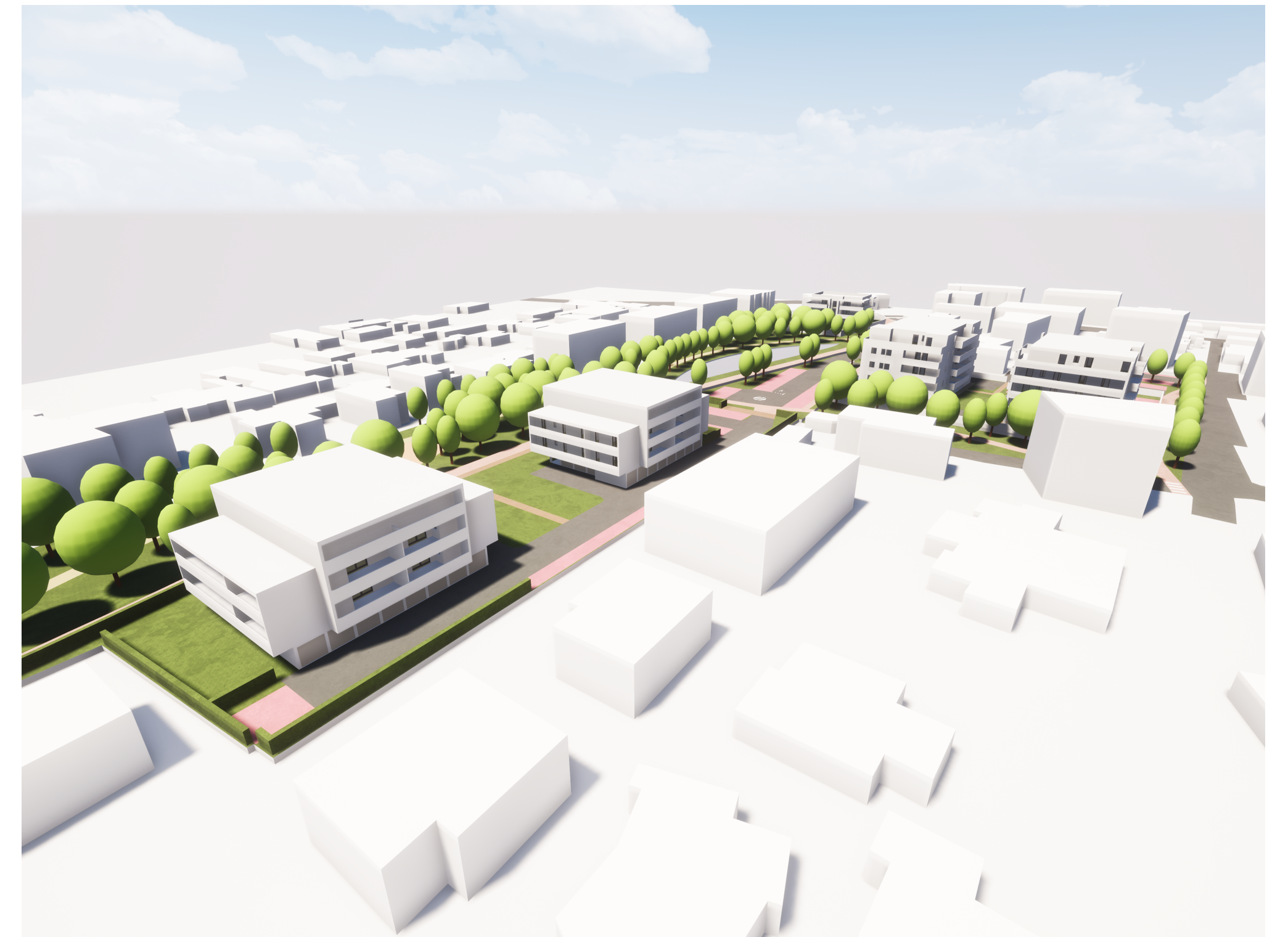
VISTA VERSO NORD OVEST 2