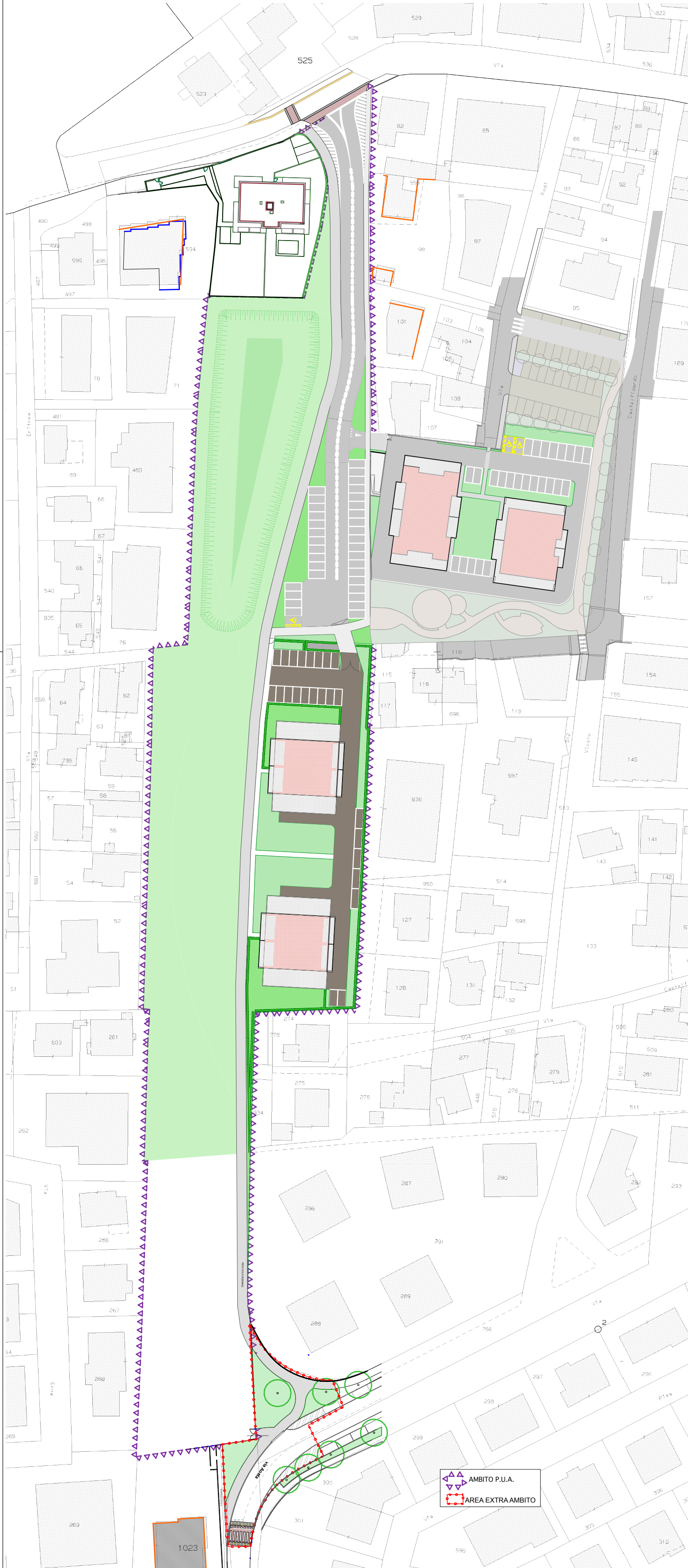
PLANIMETRIA APP A07

Il presente disegno è di nostra proprietà e non può essere riprodotto né consegnato a terzi senza N.S. autorizzazione scritta Legge 22 Aprile 1941 n° 633