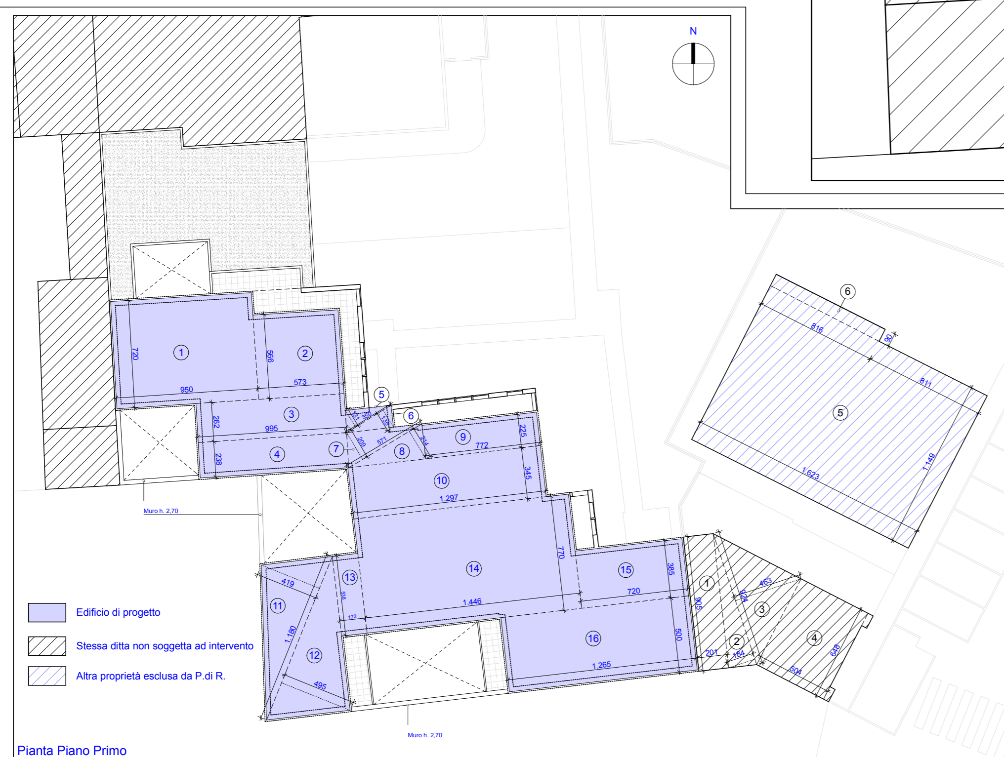
Pianta Piano Primo

INFORMAZIONI E DISEGNO SONO DI PROPRIETA' ESCLUSIVA DELLO STUDIO MICALIZZI E RUZZA GRIGGIO ARCHITETTI ASSOCIATI - LA DIFFUSIONE E LA RIPRODUZIONE SENZA AUTORIZZAZIONE SONO VIETATE A TERMINI DI LEGGE