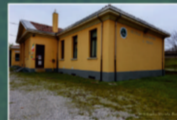
Sede Gruppo Alpini

Fondato nel 1978 il Gruppo Alpini San Gregorio Magno si è particolarmente impegnato in questi anni nel tenere alti i valori che contraddistinguono la nostra Associazione, in particolare sul fronte della solidarietà e dell'incontro con le giovani generazioni; ogni anno, inf atti, incontriamo