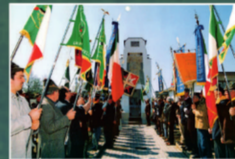
Inaugurazione Monumento restaurato aprile 2003