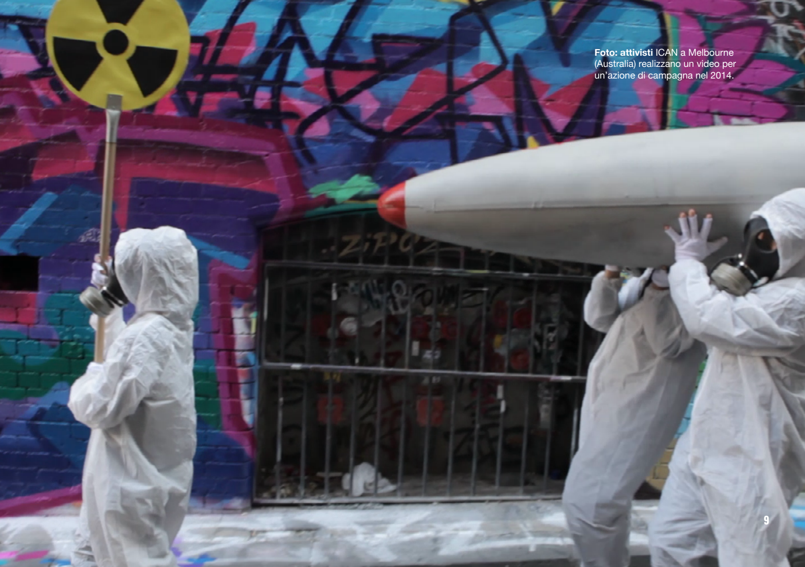
Foto: attivisti ICAN a Melbourne (Australia) realizzano un video per un'azione di campagna nel 2014.