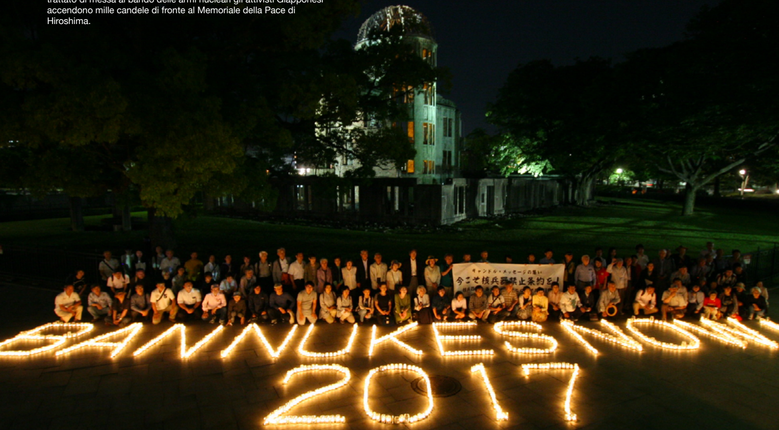
Foto: Giugno 2017, mentre a New York iniziano i negoziati per un trattato di messa al bando delle armi nucleari gli attivisti Giapponesi accendono mille candele di fronte al Memoriale della Pace di Hiroshima.