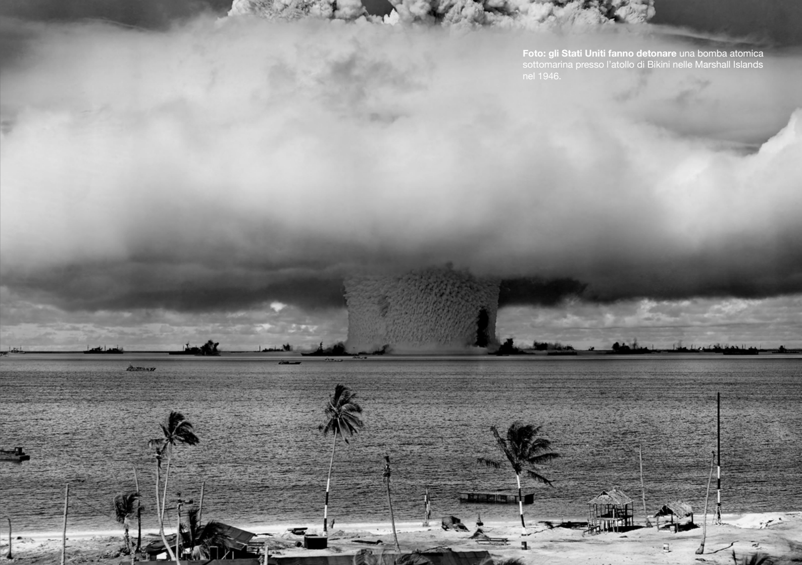
Foto: gli Stati Uniti fanno detonare una bomba atomica sottomarina presso l'atollo di Bikini nelle Marshall Islands nel 1946.