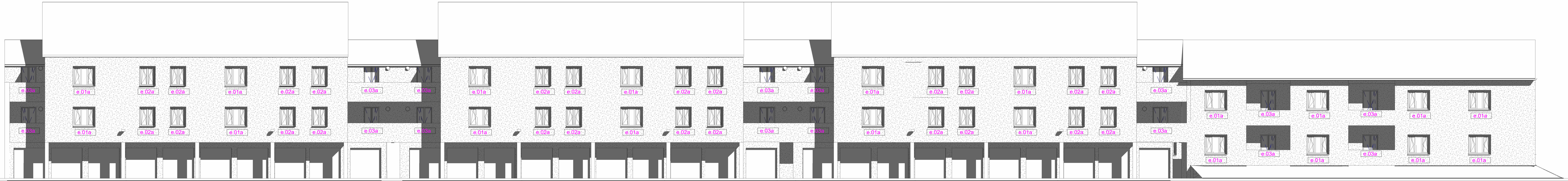
Prospetto NORD esterno scala 1:100