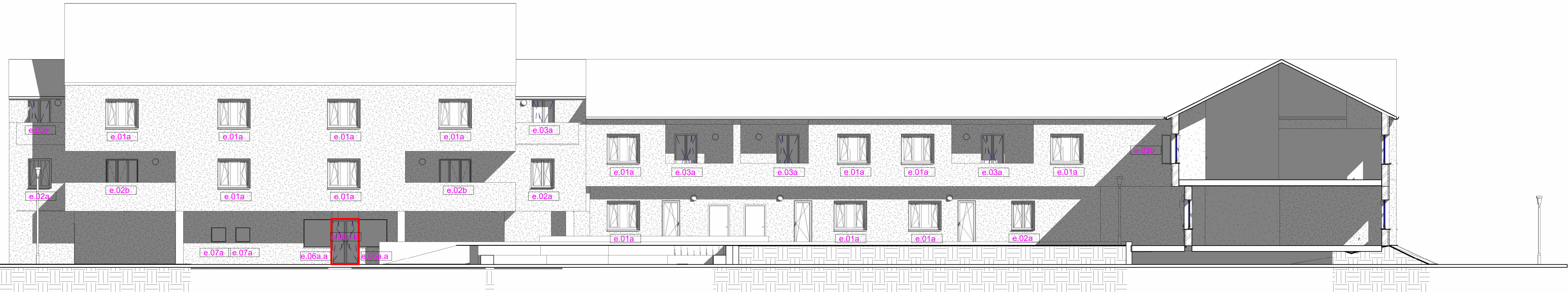
Sezione 3 - Prospetto SUD interno scala 1:100