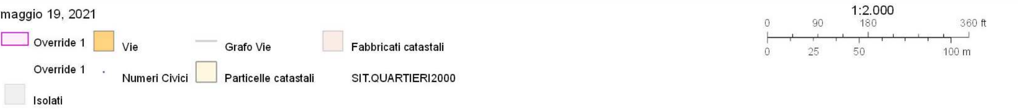
ESTRATTO DI MAPPA scala 1:2000