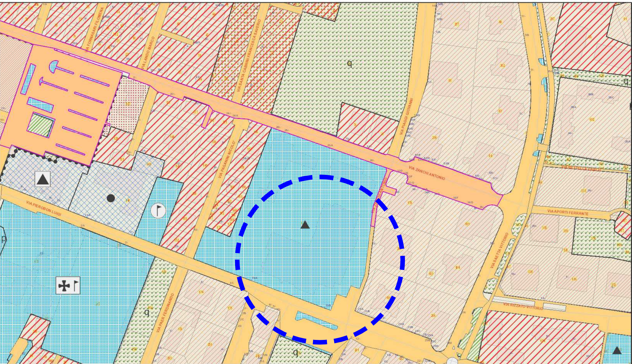
ESTRATTO DI P.R.G.