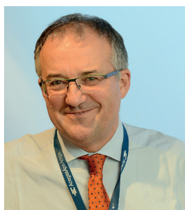
L'Amministratore Delegato di AcegasApsAmga

La informiamo comunque già da ora, che i bidoni saranno consegnati a partire da aprile da operatori identificabili con apposito tesserino di riconoscimento, a disposizione per valutare e risolvere ogni problema logistico.