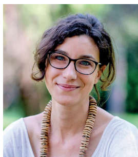
L'Assessore all'Ambiente del Comune di Padova