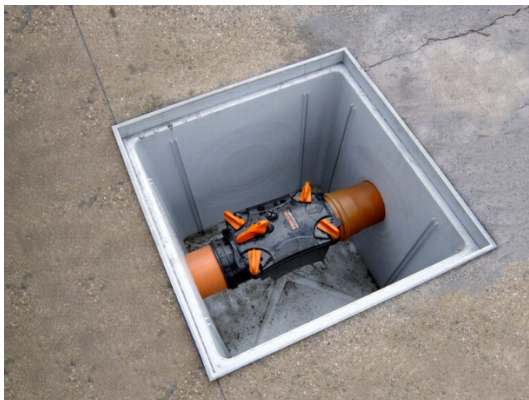
Figura 5 – Valvola antiriflusso