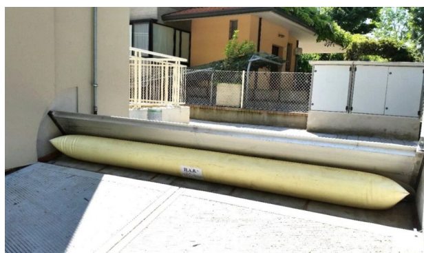
Figura 3 – Barriera a sollevamento pneumatico