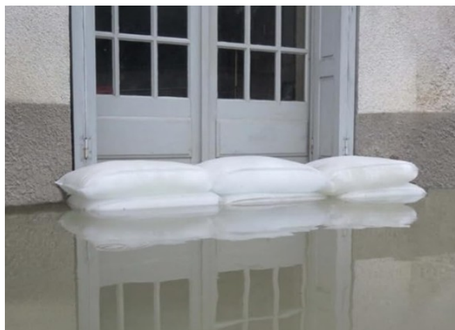
Figura 9 – Sacchi autoespandenti