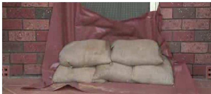
Figura 10 – Sacchi di sabbia