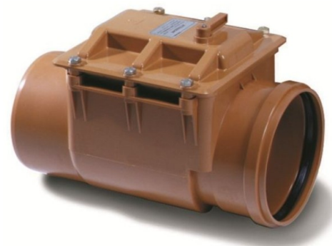
Figura 6 – Valvola antiriflusso