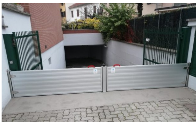
Figura 1 – Barriera anti-allagamento modulare