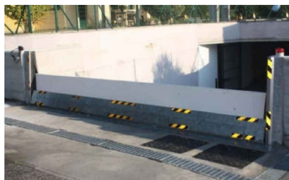
Figura 4 – Barriera a sollevamento elettromeccanico