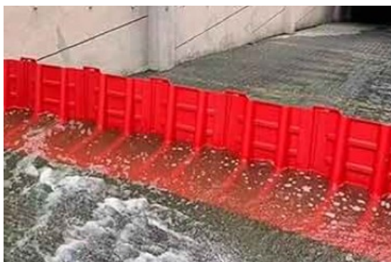
Figura 7 – Barriera anti-allagamento modulare