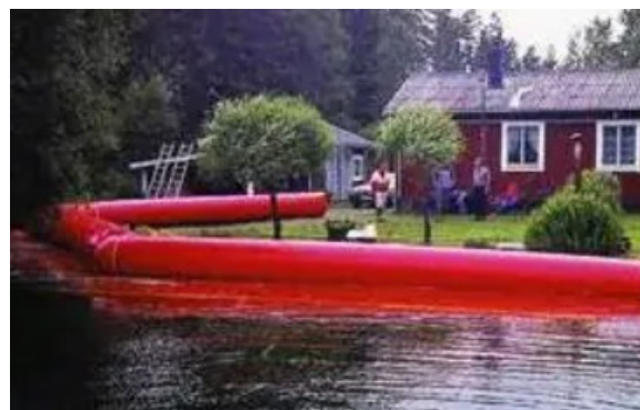
Figura 8 – Barriera anti-allagamento gonfiabile