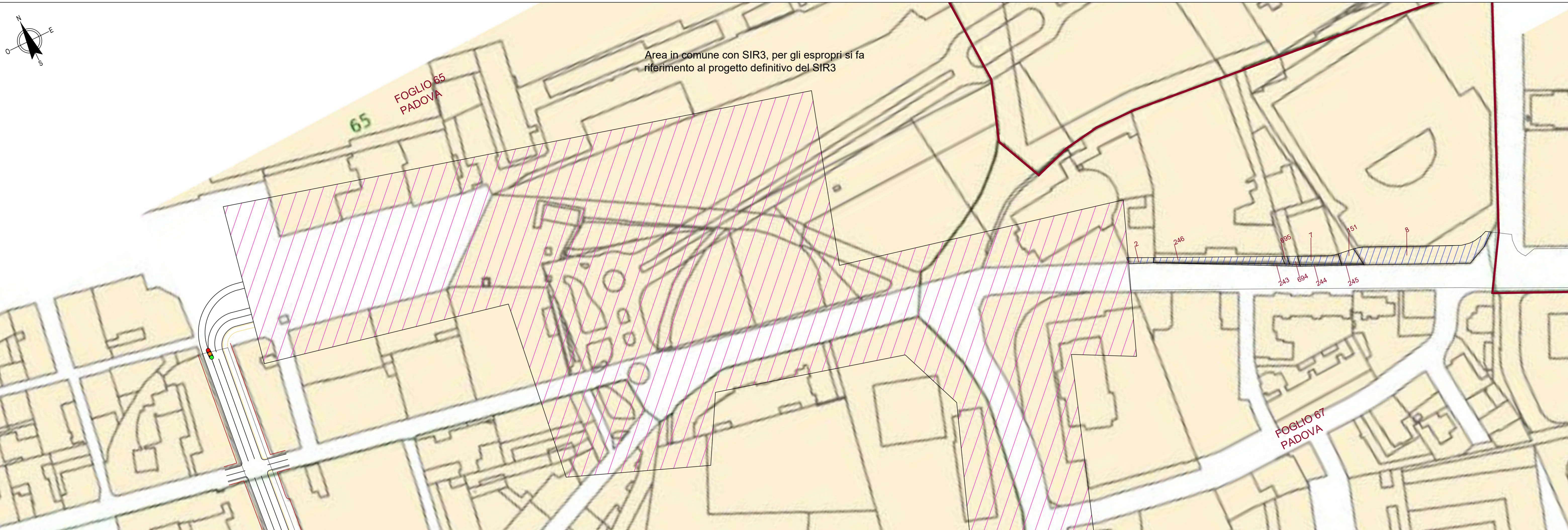
PLANIMETRIA DEGLI ESPROPRI COMUNE DI PADOVA