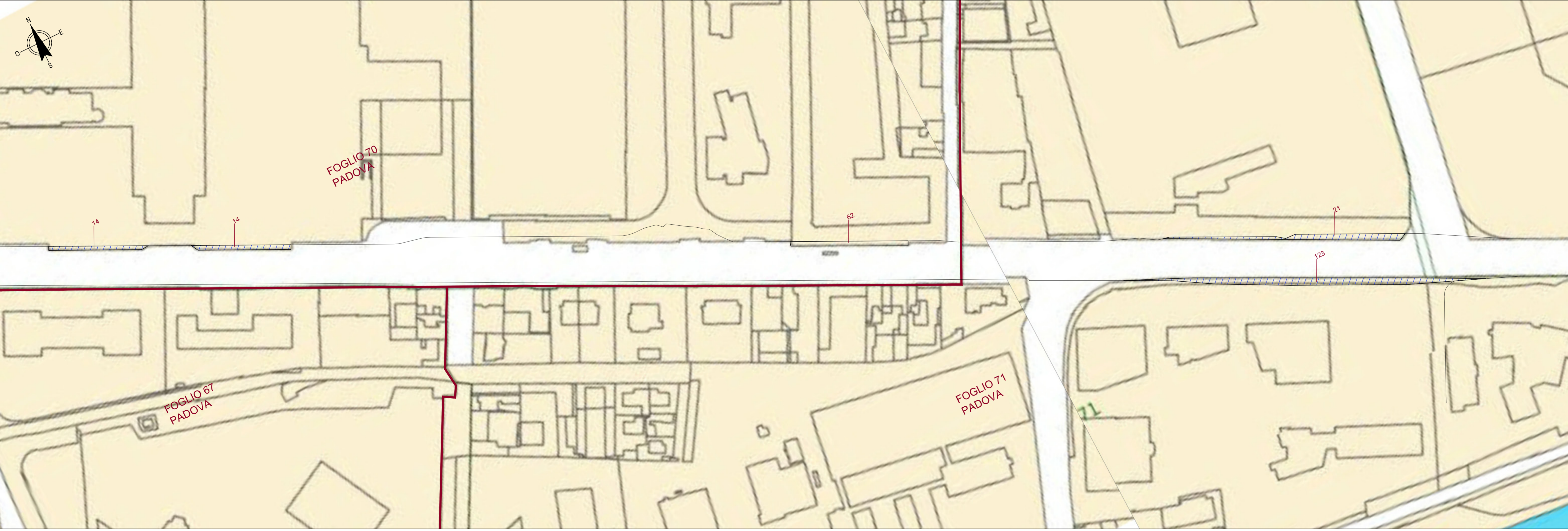
PLANIMETRIA DEGLI ESPROPRI COMUNE DI PADOVA