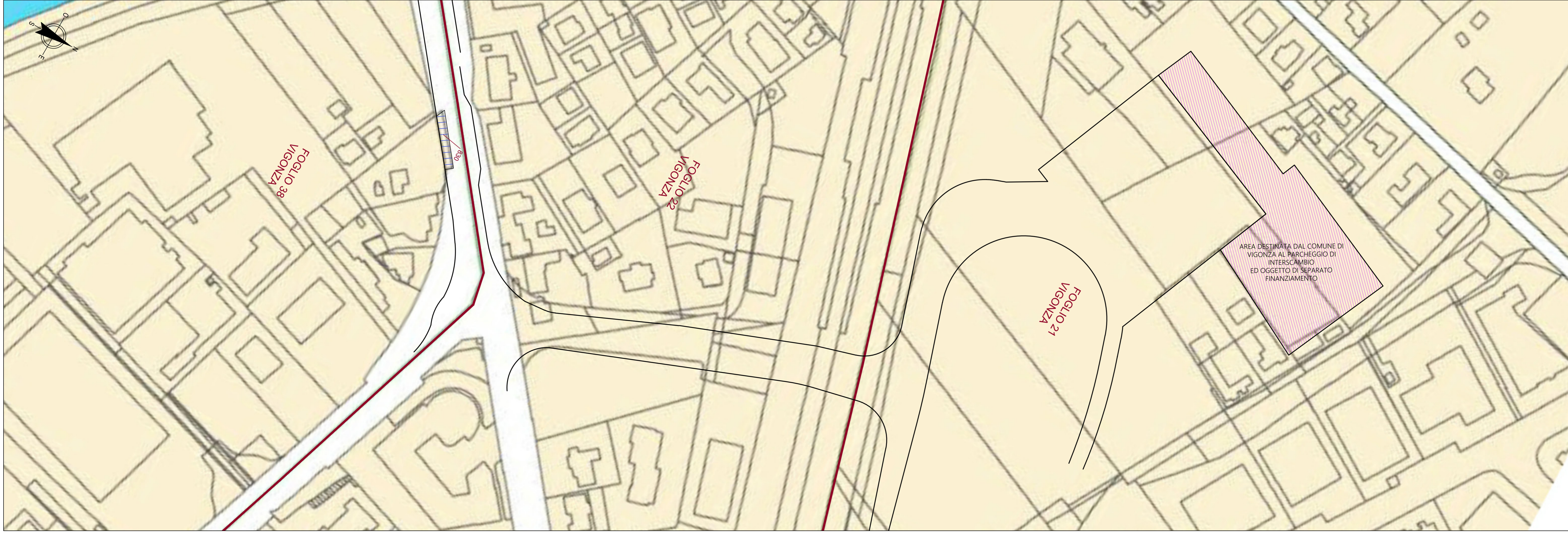
PLANIMETRIA DEGLI ESPROPRI COMUNE DI VIGONZA