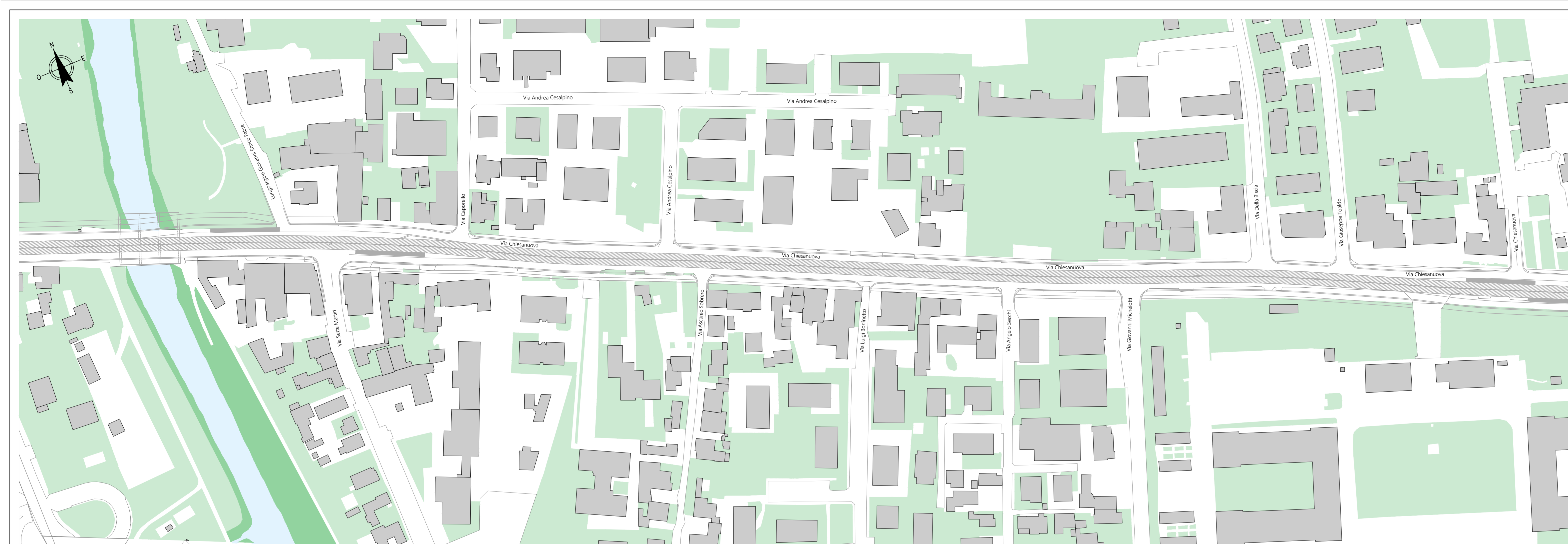
PLANIMETRIA DI CONFRONTO STATO DI FATTO PROGETTO