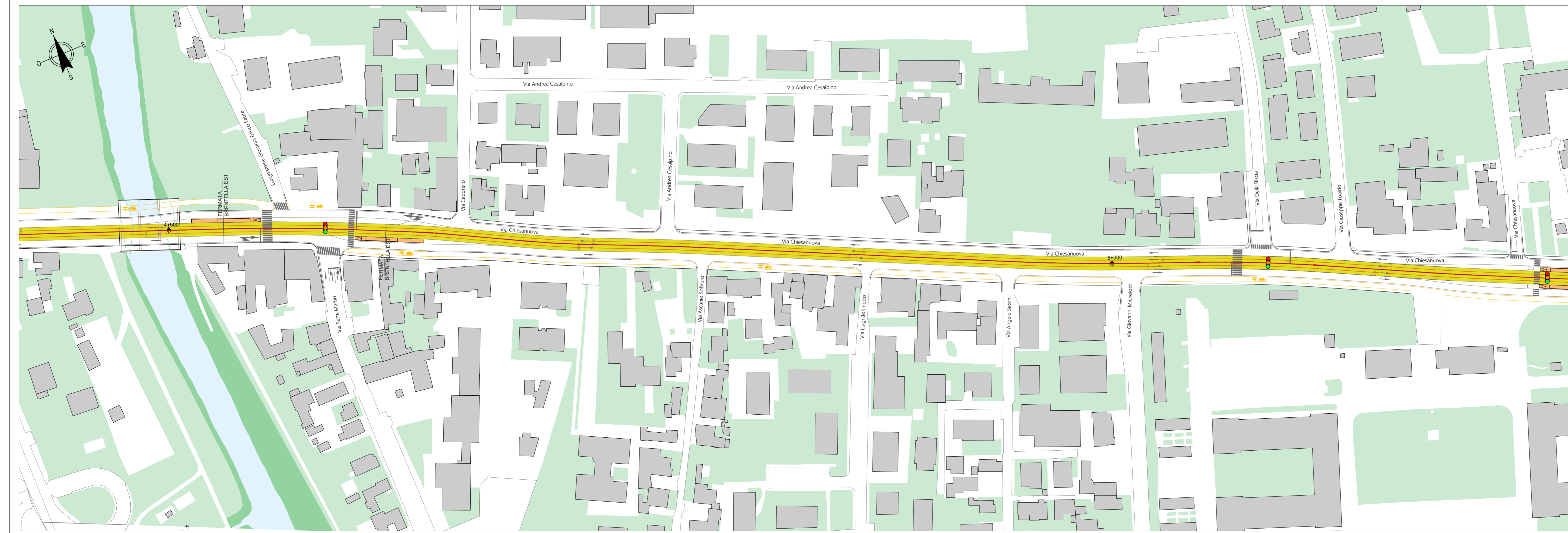
PLANIMETRIA DI PROGETTO