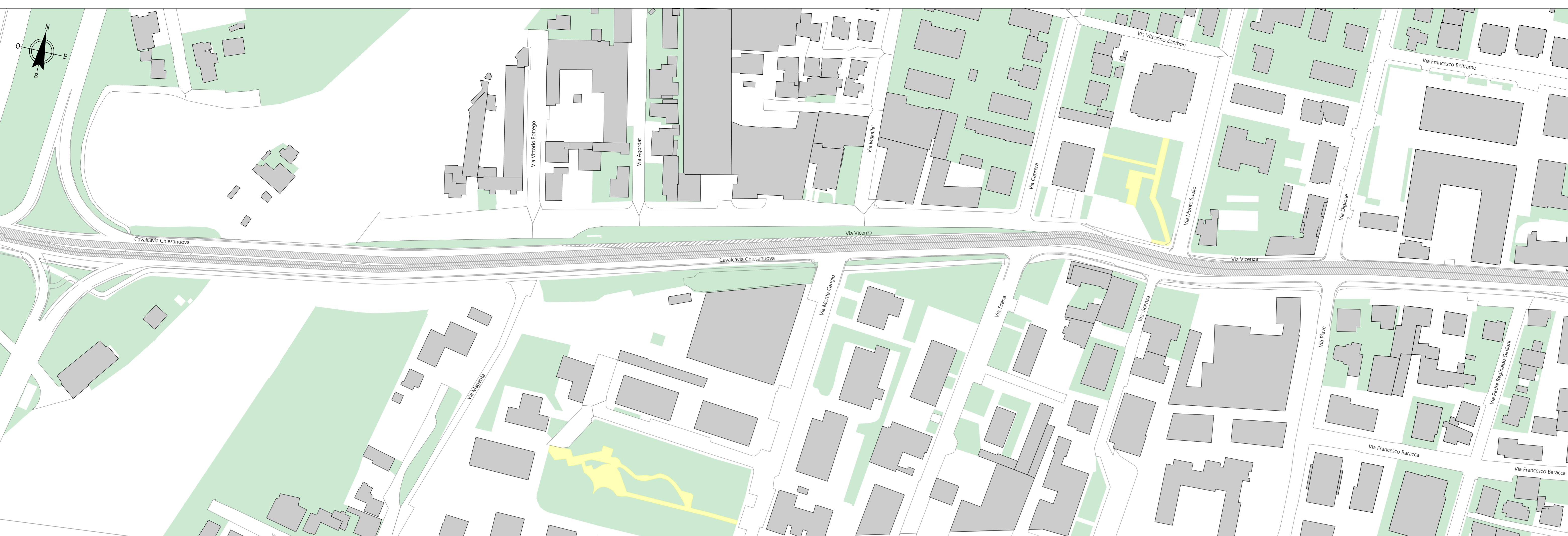
PLANIMETRIA DI CONFRONTO STATO DI FATTO PROGETTO