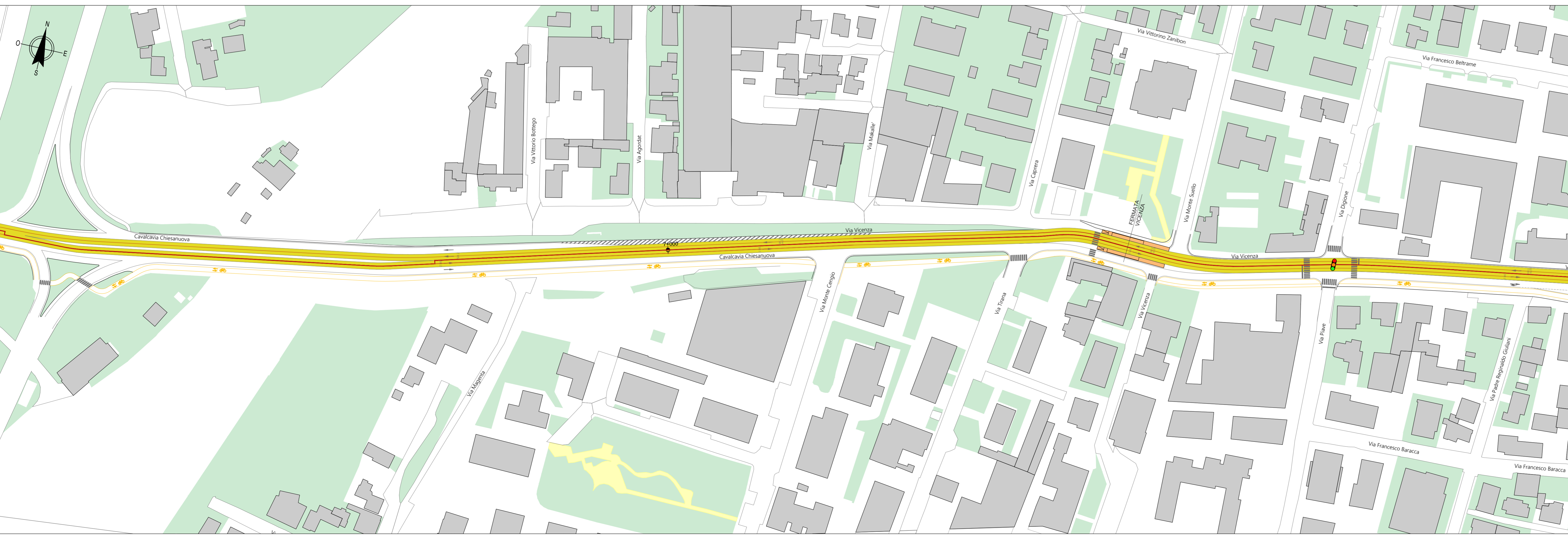
PLANIMETRIA DI PROGETTO