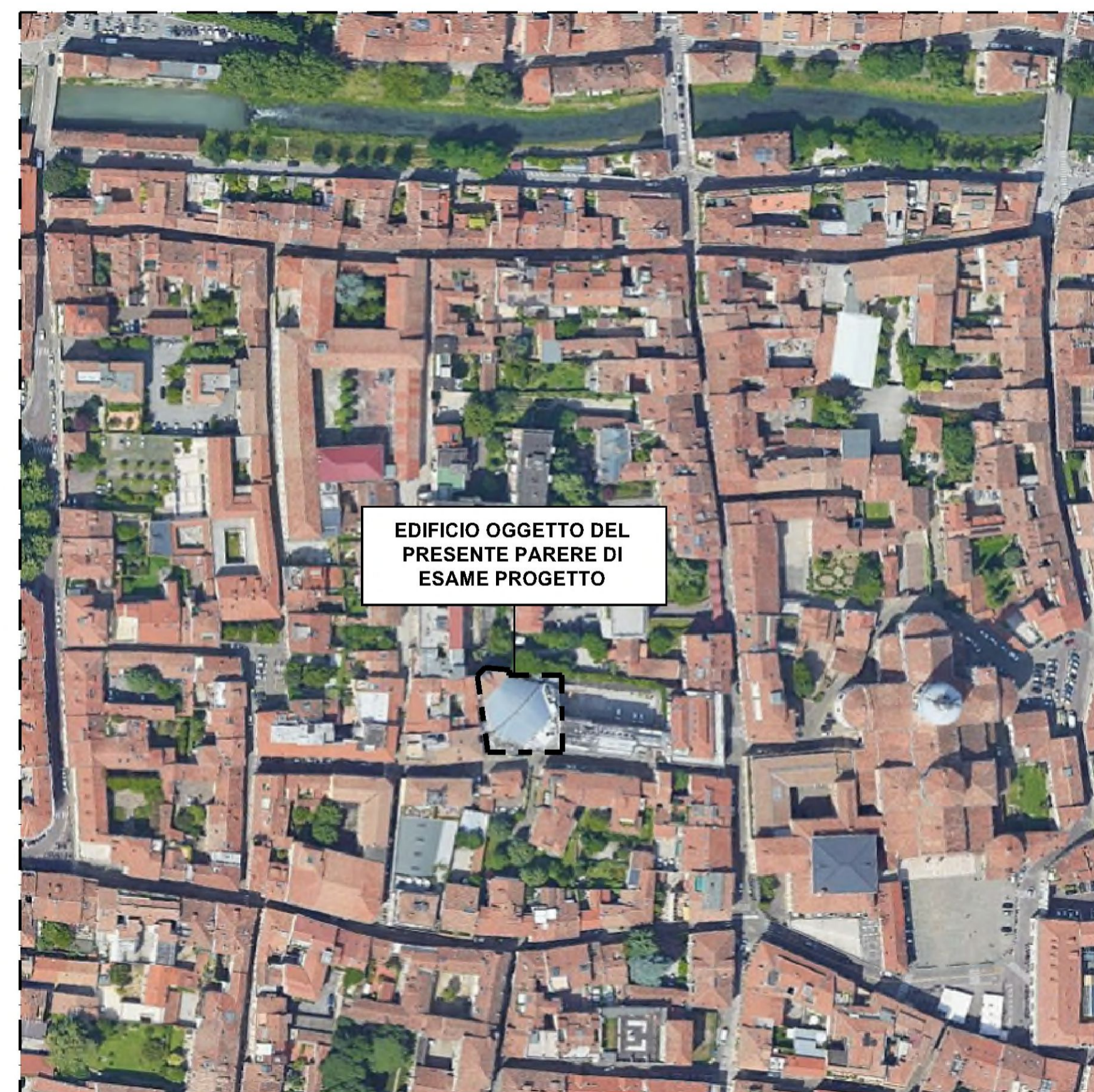
MAPPA SATELLITARE Scala 1:2000