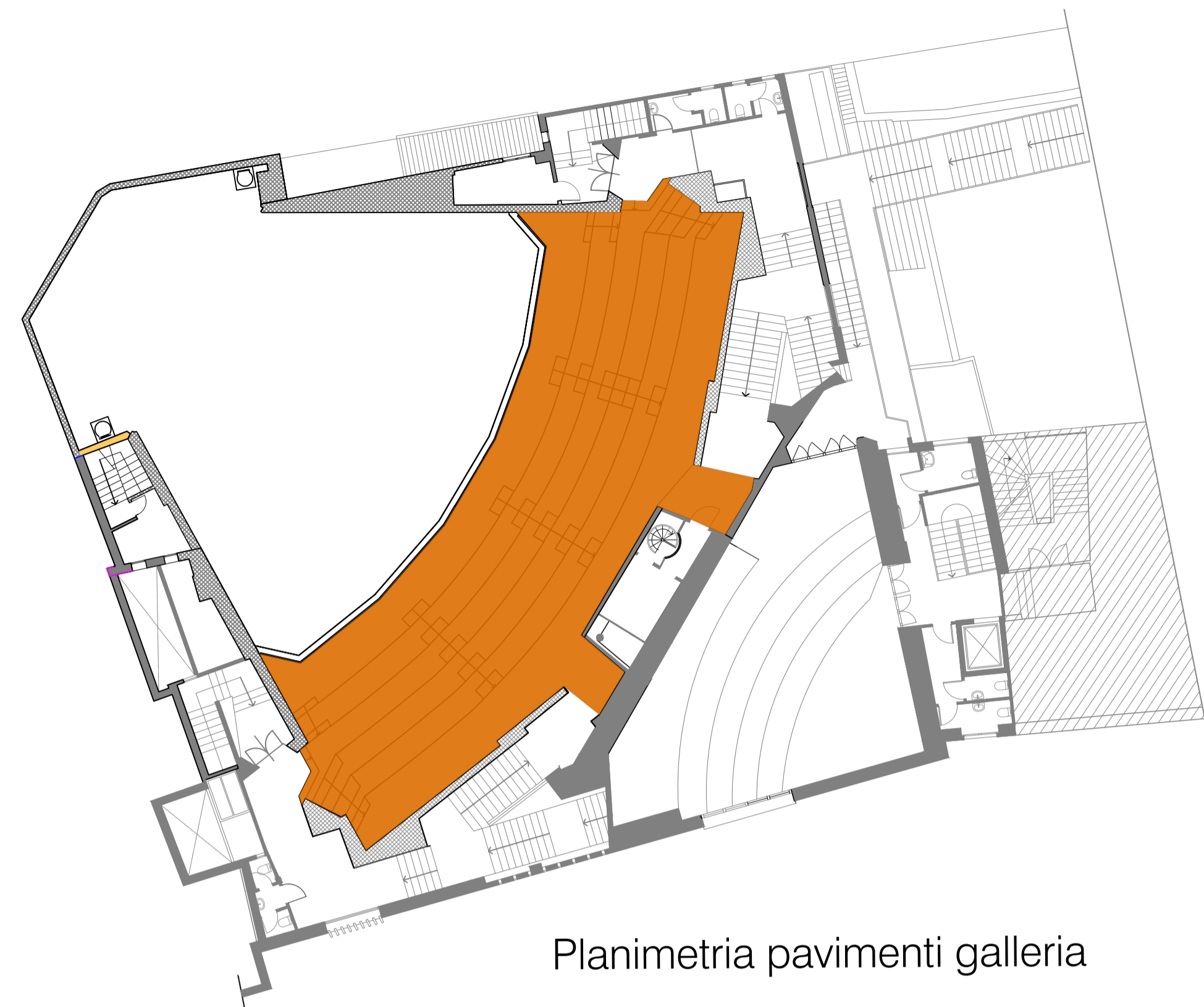
Planimetria pavimenti galleria