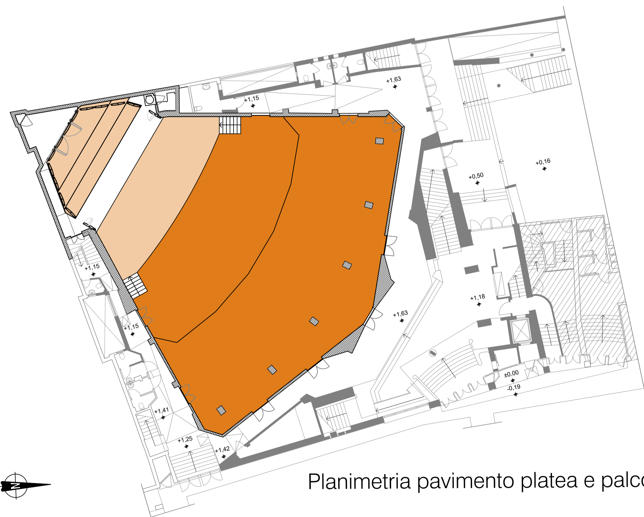
Planimetria pavimento platea e palco