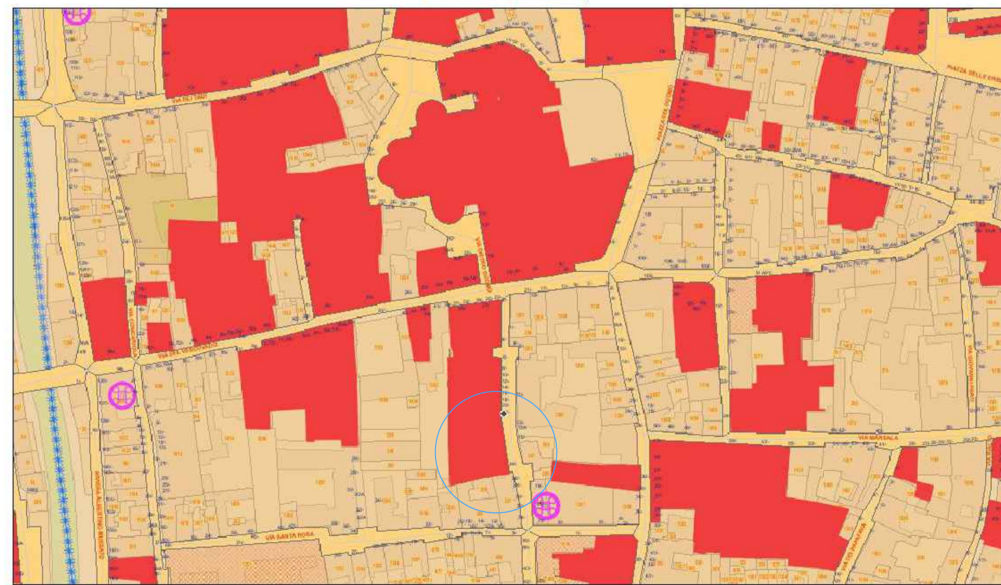
Cartografia tecnica mappa interattiva | Estratto Carta dei Vincoli e della Pianificazione Territoriale Vincolo sui beni culturali D.Lgs. 42/2004 art. 10 e 12 - art. 5.1 NTA Vincoli derivati da Pianificazione di livello superiore Centro Storico - art. 5.5.1 NTA