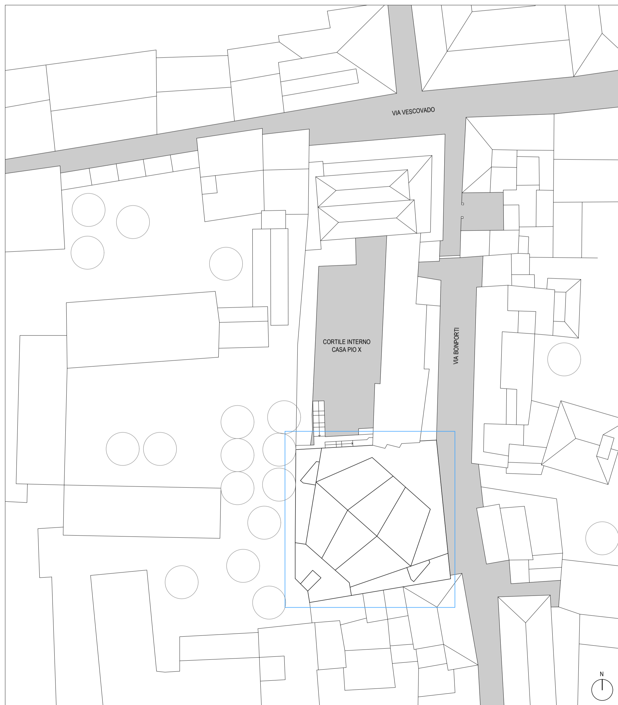
PLANIMETRIA GENERALE | 1:500