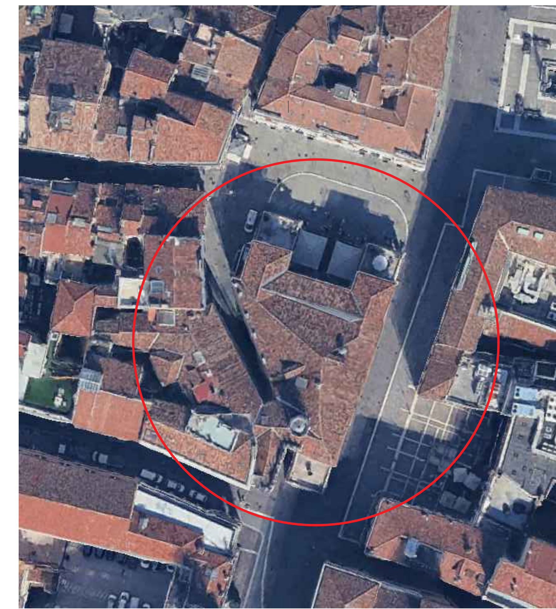
ORTOFOTO - istantanea del 05/03/2025