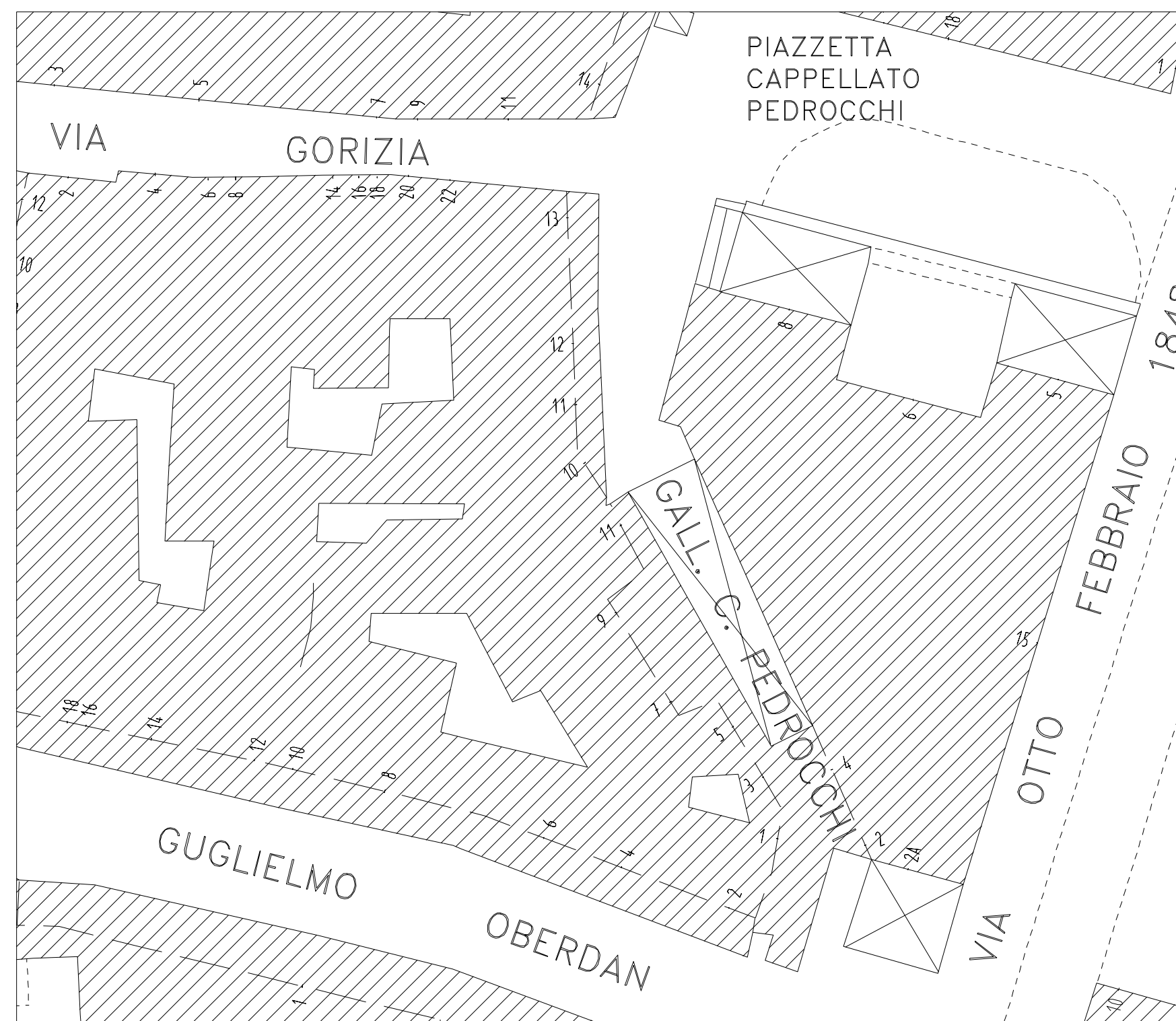
ESTRATTO CARTA CTR - 1996, Regione Veneto