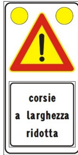
Figura Il 391c Art. 31