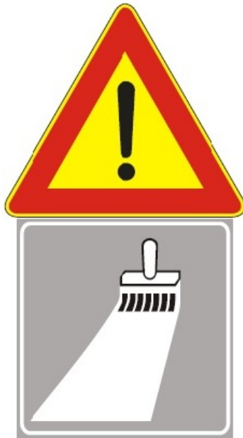
Figura Il 391 Art. 31