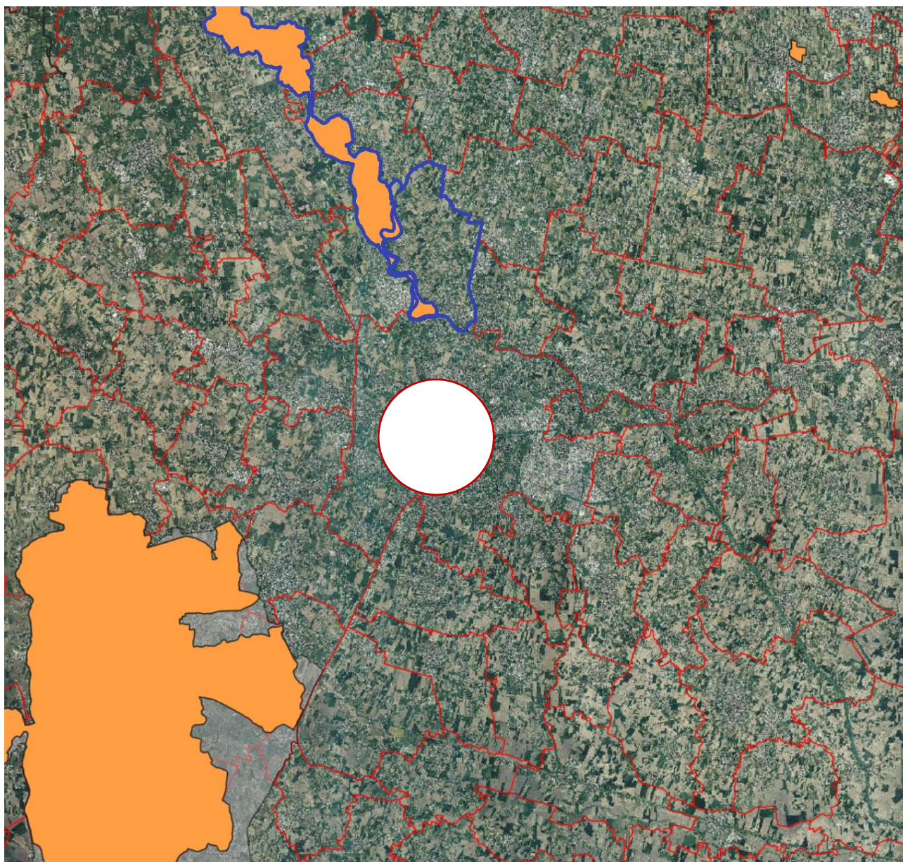
Figura 1. Comune di Padova e aree Natura 2000.

Di seguito si riporta l'individuazione delle aree Natura 2000.