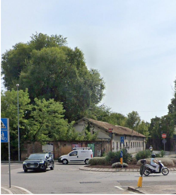
1. Rotonda che collega Corso Milano con Via Orsini