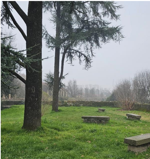
3. Bastione Savonarola