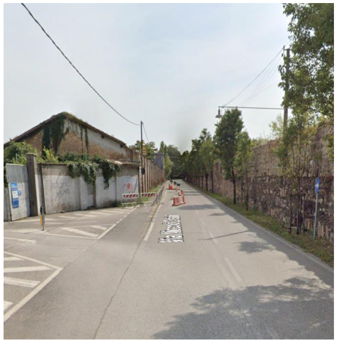
6. Ingresso al parcheggio pubblico da Via Orsini