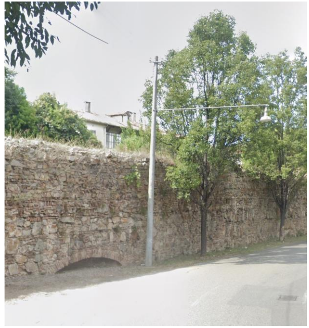
14. Vista delle Mura lungo Via Orsini