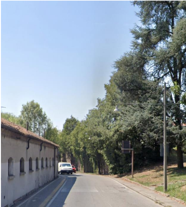
5. Via Orsini provenendo da Corso Milano