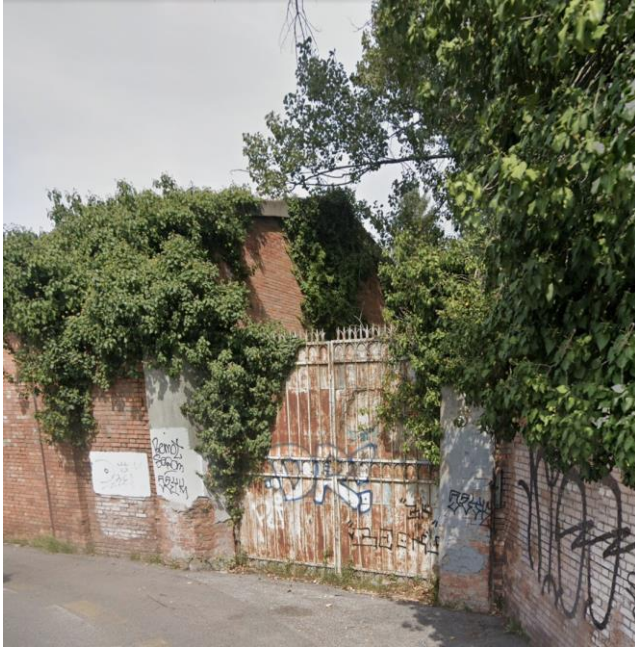
13. Cancelli di ingresso alla Prandina da Via Orsini