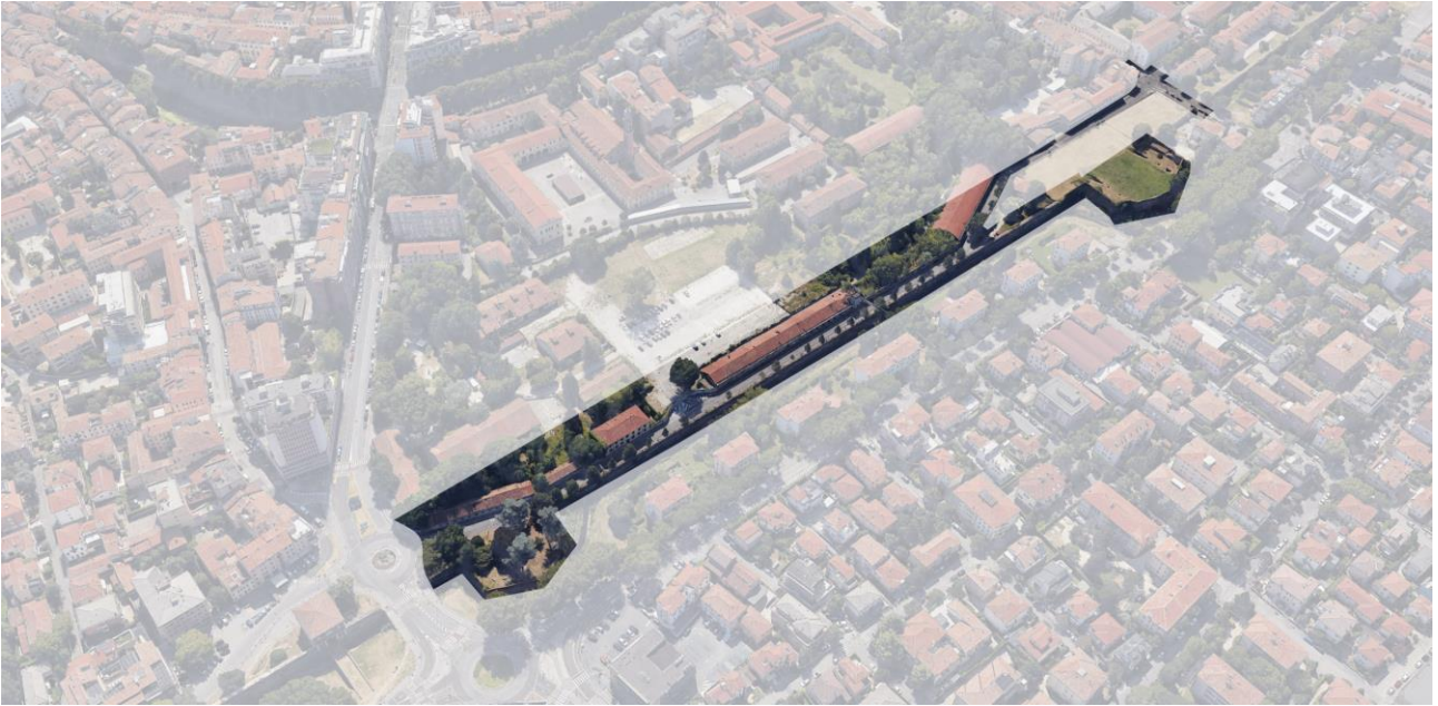
Ambito d'intervento per la Riqualificazione Verde del parco delle Mura di San Benedetto