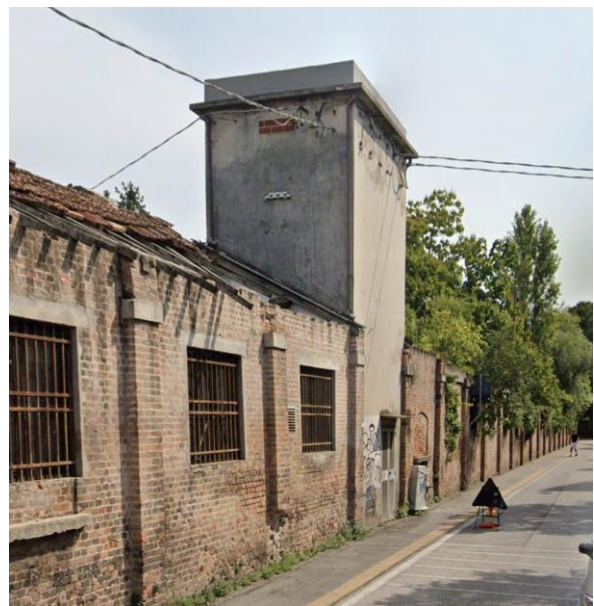
8. Cabina Enel da mantenere collocata su Via Orsini