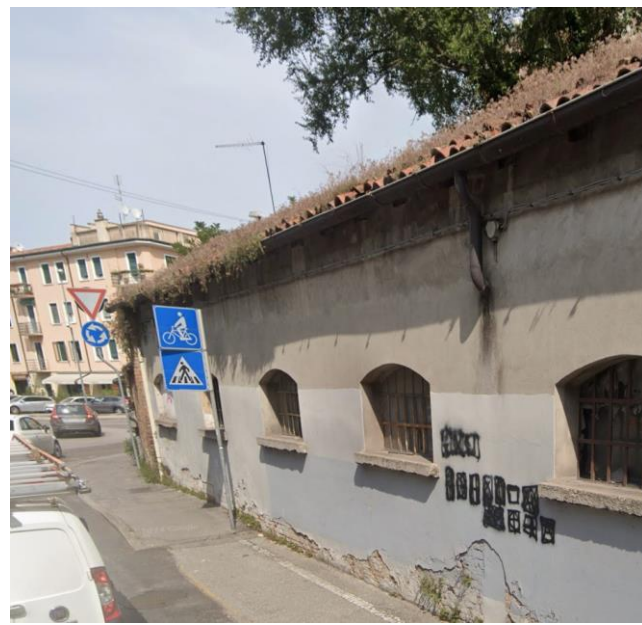
20. Edificio in fase di demolizione confinante con Via Orsini