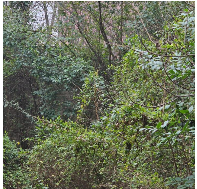
4. Vegetazione incolta all'interno della Ex Caserma