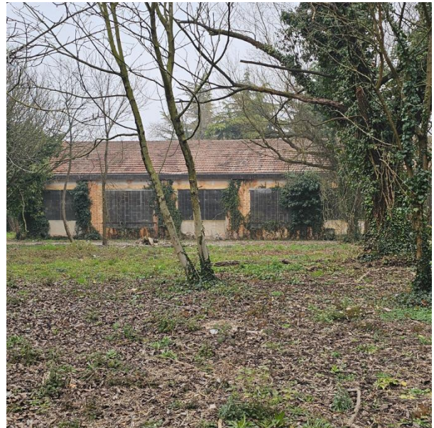
16. Corpo di fabbrica lungo via Orsini