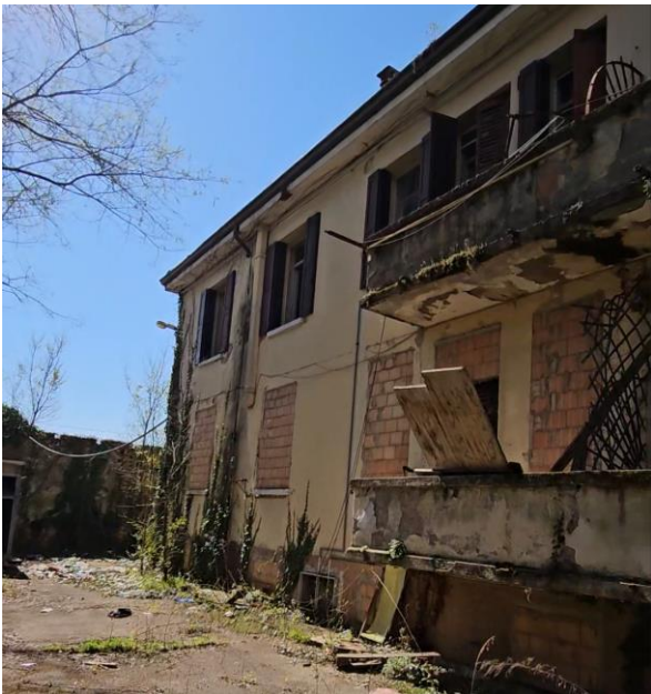
19. Edifici in fase di demolizione