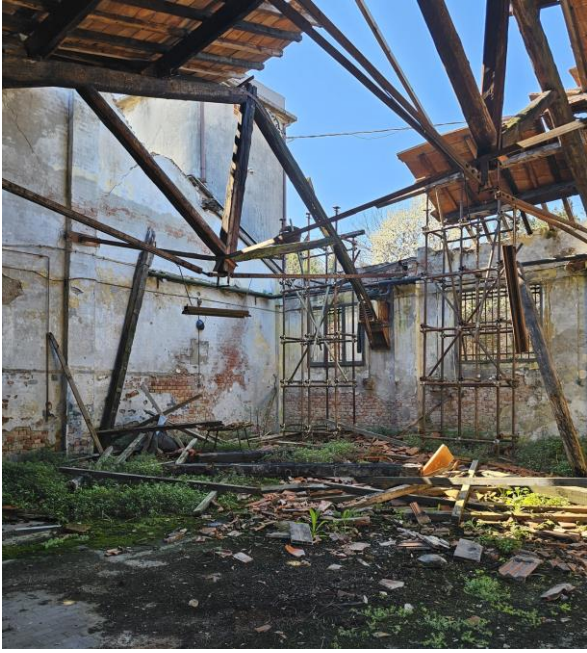
17. La cabina Enel vista dall'interno della Caserma