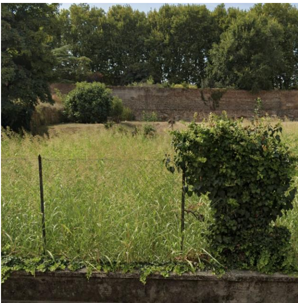
11. Vista del Baluardo Prosdocimo da Via Orsini