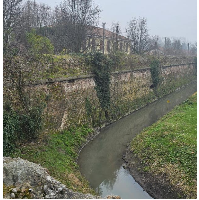
2. Fossa Bastione