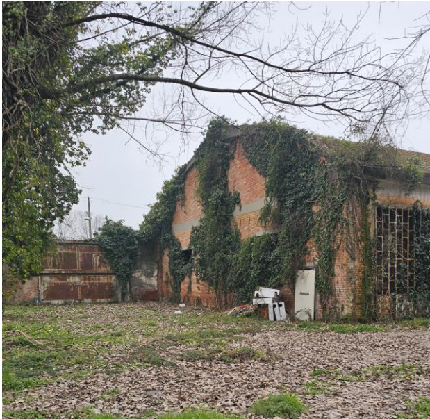
15. Il cancelli di ingresso alla Prandina verso Via Orsini