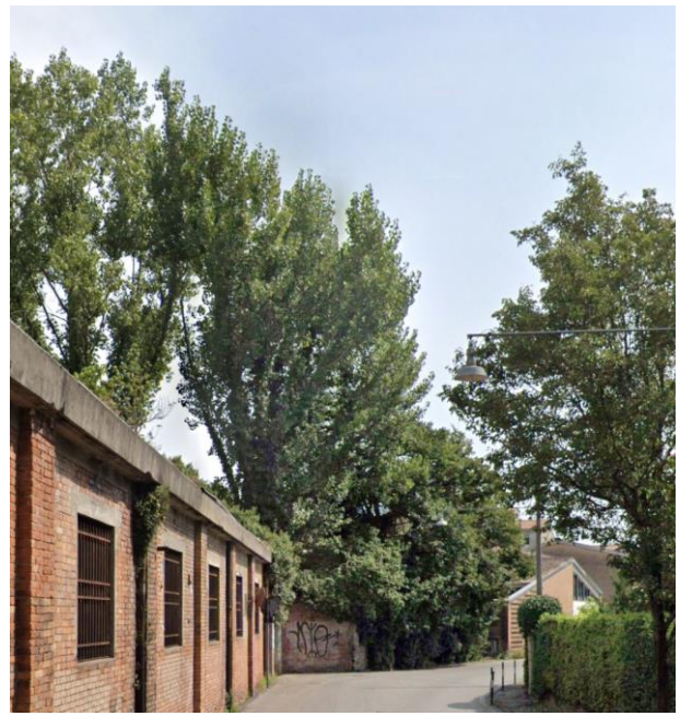
10. Via Orsini e gli edifici della caserma in fase di demolizione