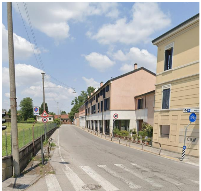
12. Inizio di Via Orsini dall'incrocio di Via Palestro