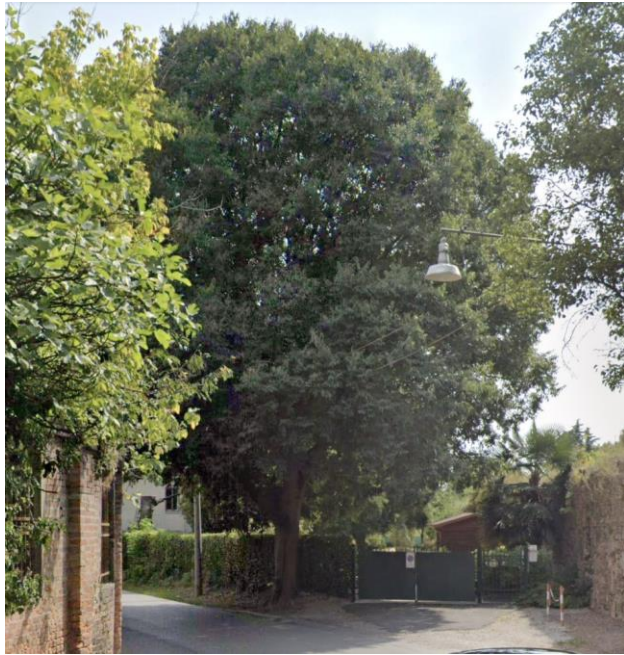
9. Ingresso alla proprietà privata da Via Orsini