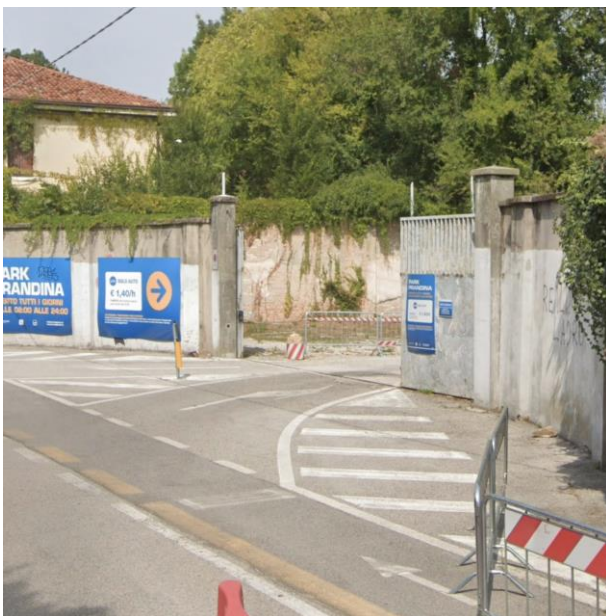
7. Attuale ingresso al Parcheggio Prandina