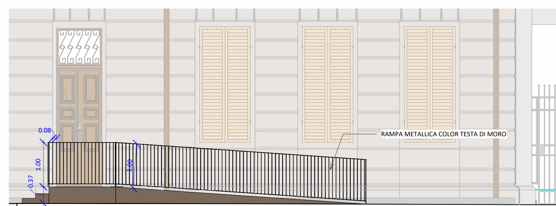
DETTAGLIO RAMPA 1:50