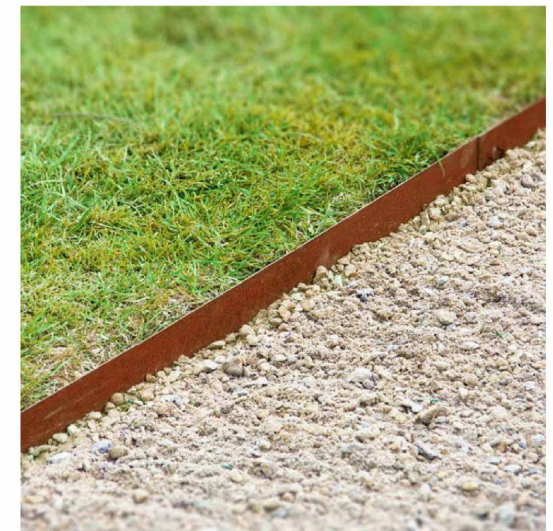
IMMAGINE TIPOLOGICA BORDURA IN FERRO COLOR MARRONE