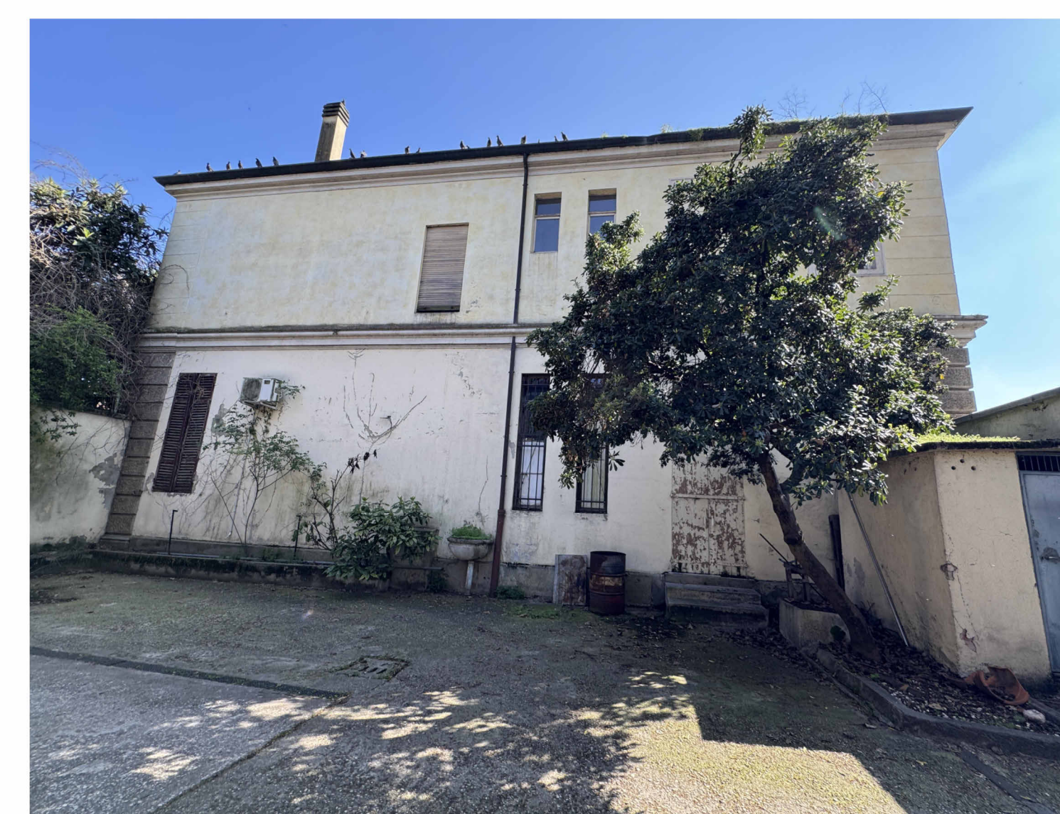
IMMAGINE AREA POSTERIORE EDIFICIO A