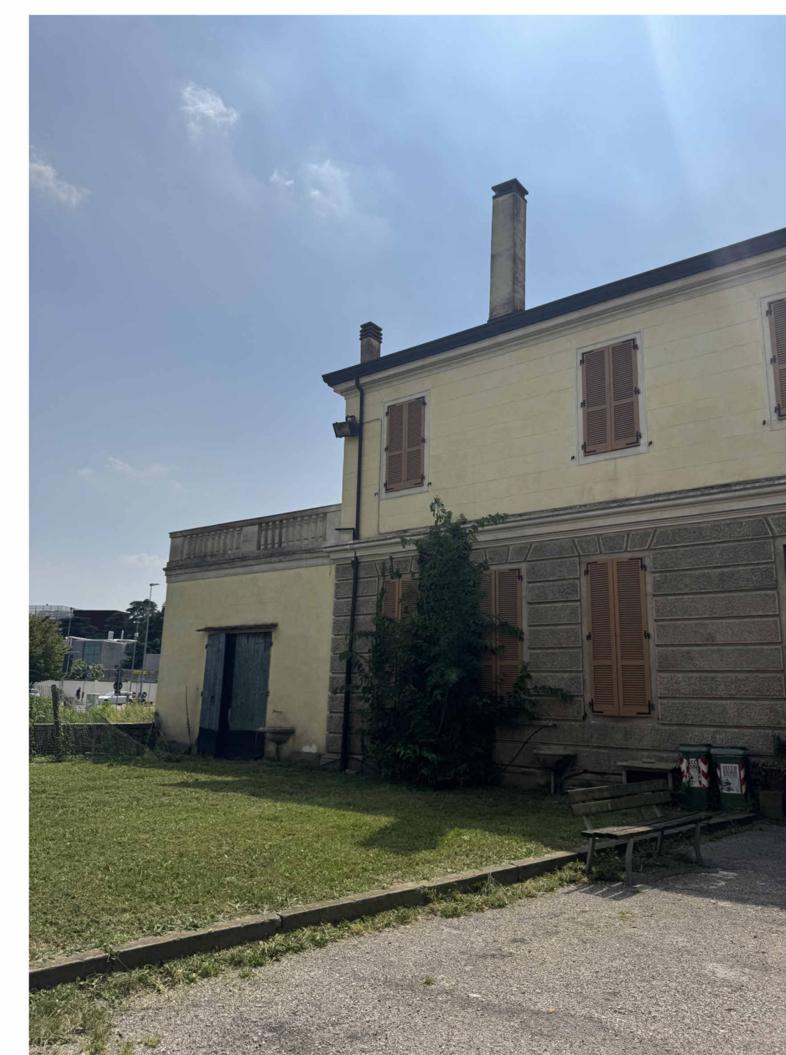
IMMAGINE AREA A PRATO GIARDINO INTERNO