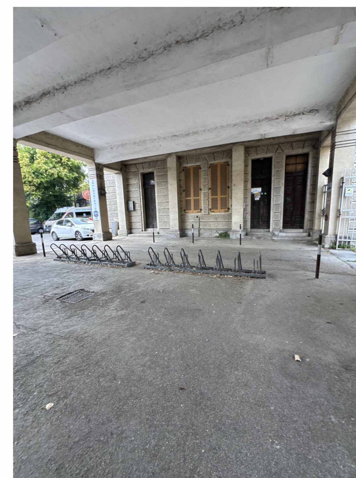
IMMAGINE AREA PORTICO