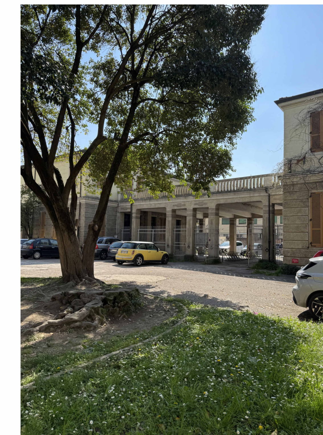
IMMAGINE AREA ESTERNA GIARDINO INTERNO