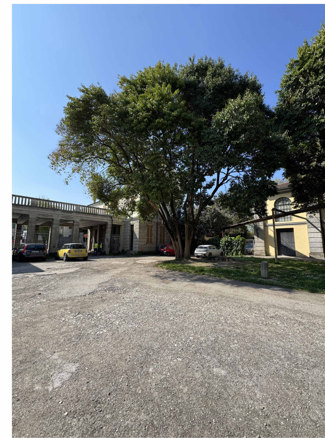
IMMAGINE AREA ESTERNA GIARDINO INTERNO

NOTA: LA RIQUALIFICAZIONE L'EDIFICIO A SARÀ OGGETTO DI UN FUTURO STRALCIO.