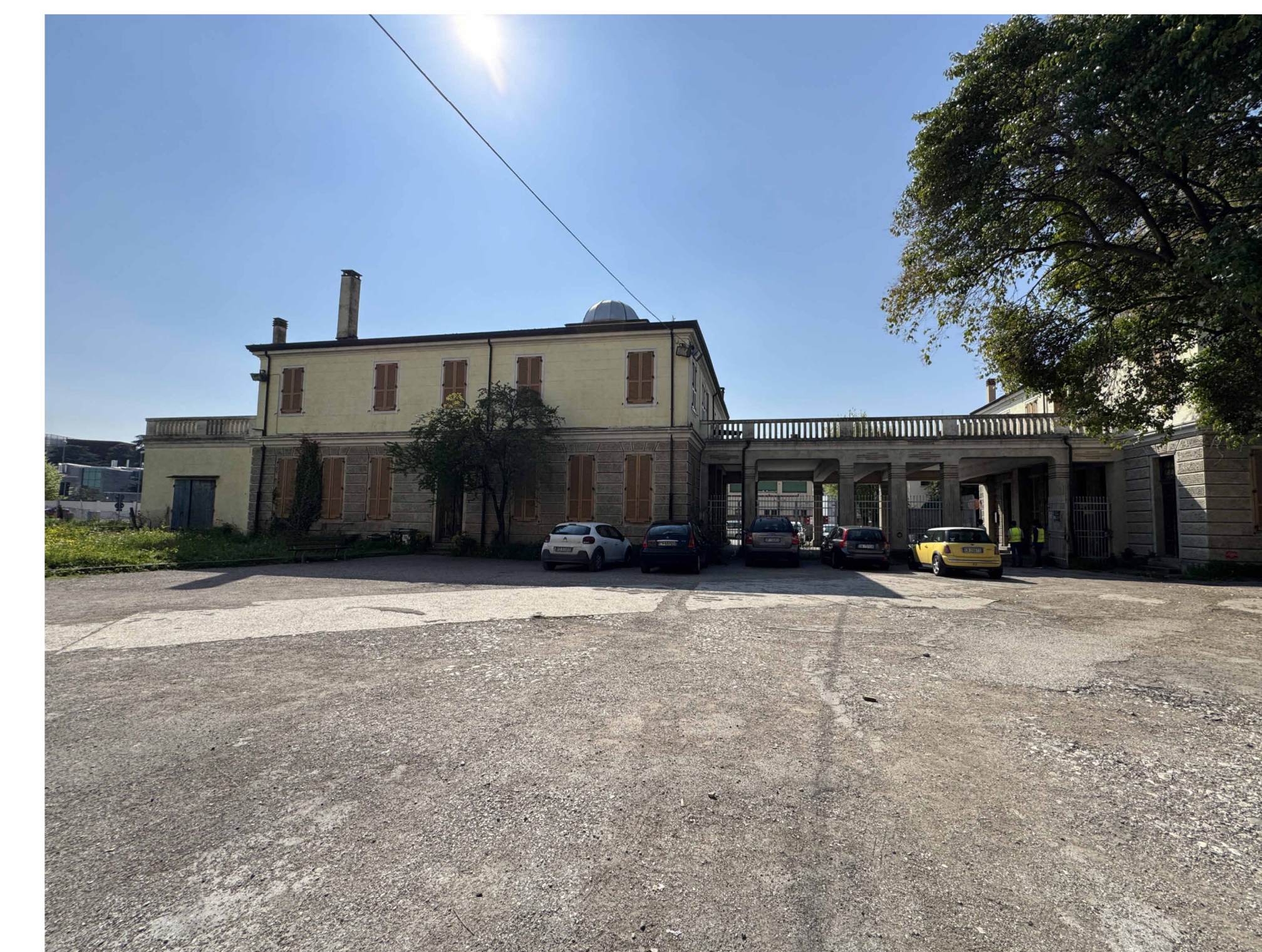
IMMAGINE AREA ESTERNA GIARDINO INTERNO