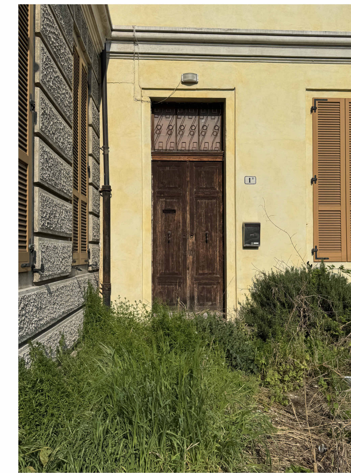
IMMAGINE AIUOLA FRONTALE