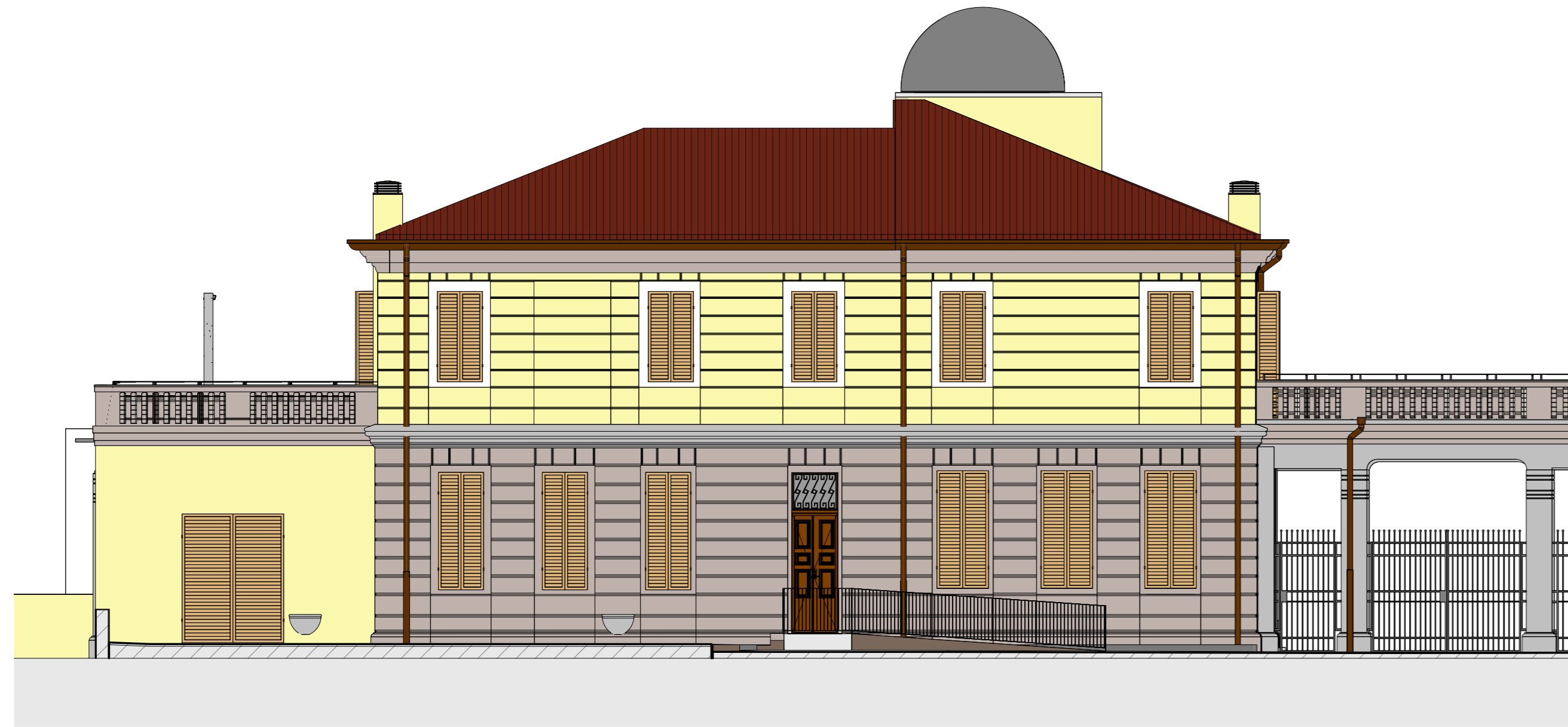
PROSPETTO NORD verso corte interna