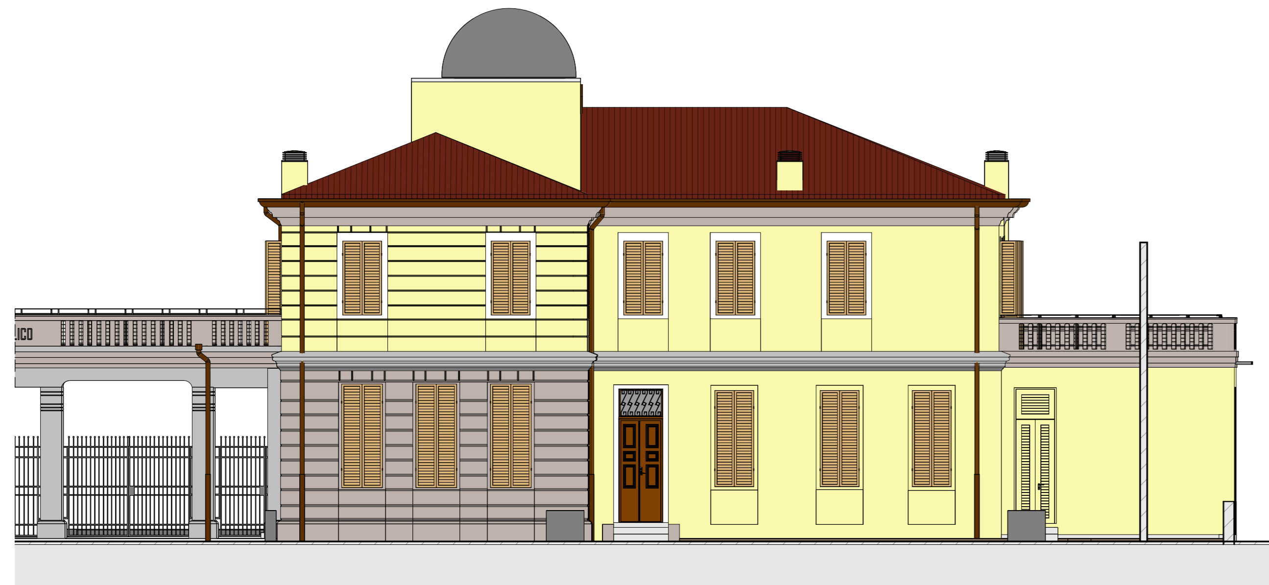
PROSPETTO SUD verso via A. Cornaro

TALE ELABORATO HA SOLO VALENZA ANTINCENDIO PER LE SPECIFICHE DI PROGETTO SI RIMANDA ALLE SINGOLE DISCIPLINE