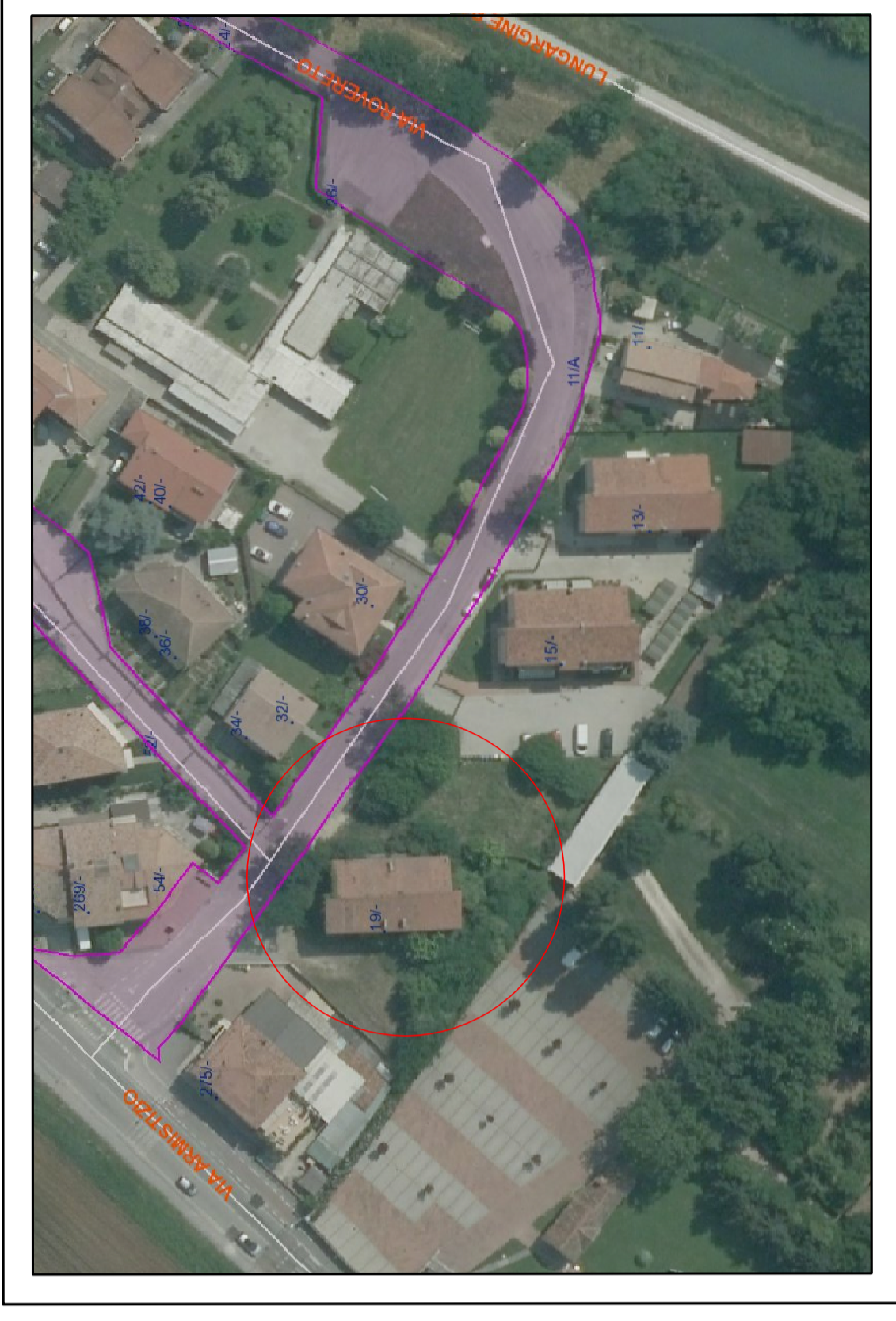
ESTRATTO AEROFOTOGRAMMETRICO scala1:1.000