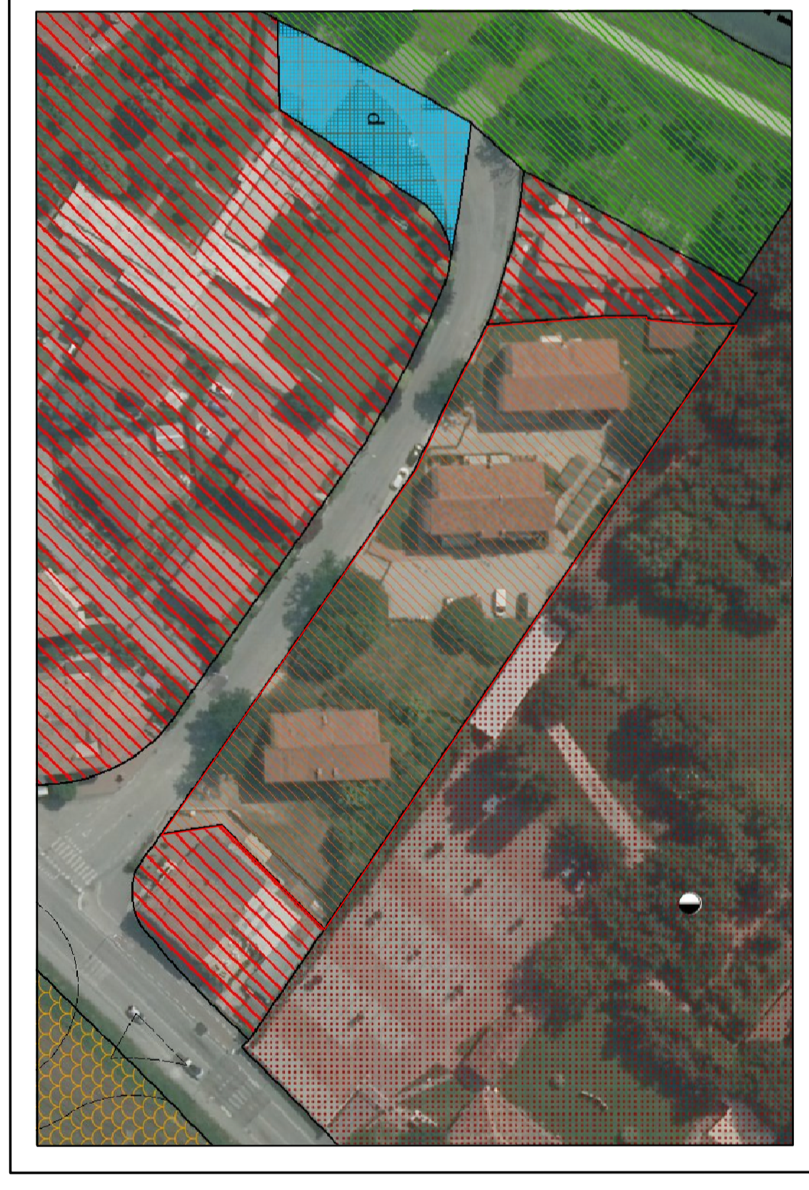
ESTRATTO P.R.G. scala1:1.000 Zona Residenziale di completamento 3