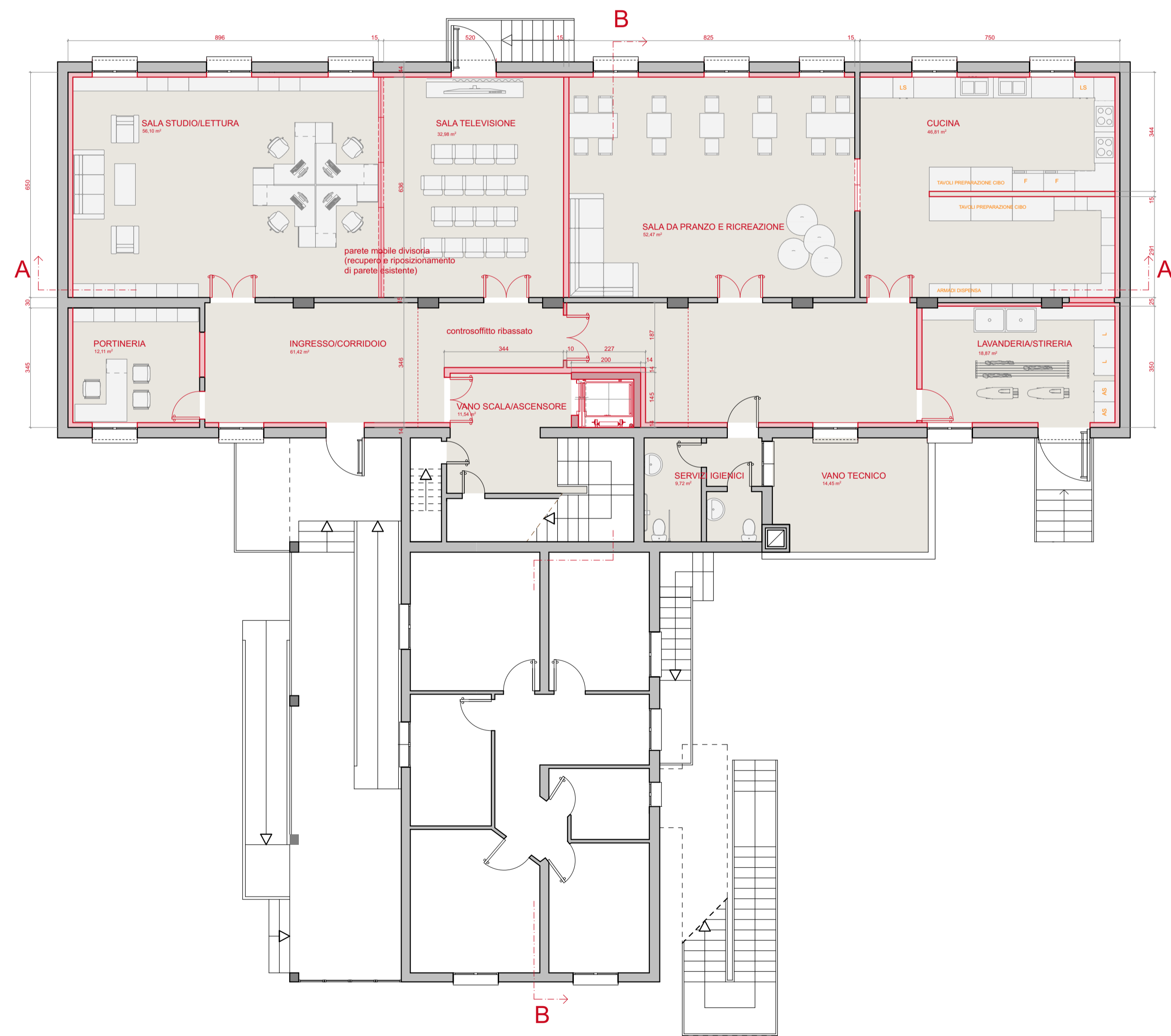
PIANTA PIANO RIALZATO