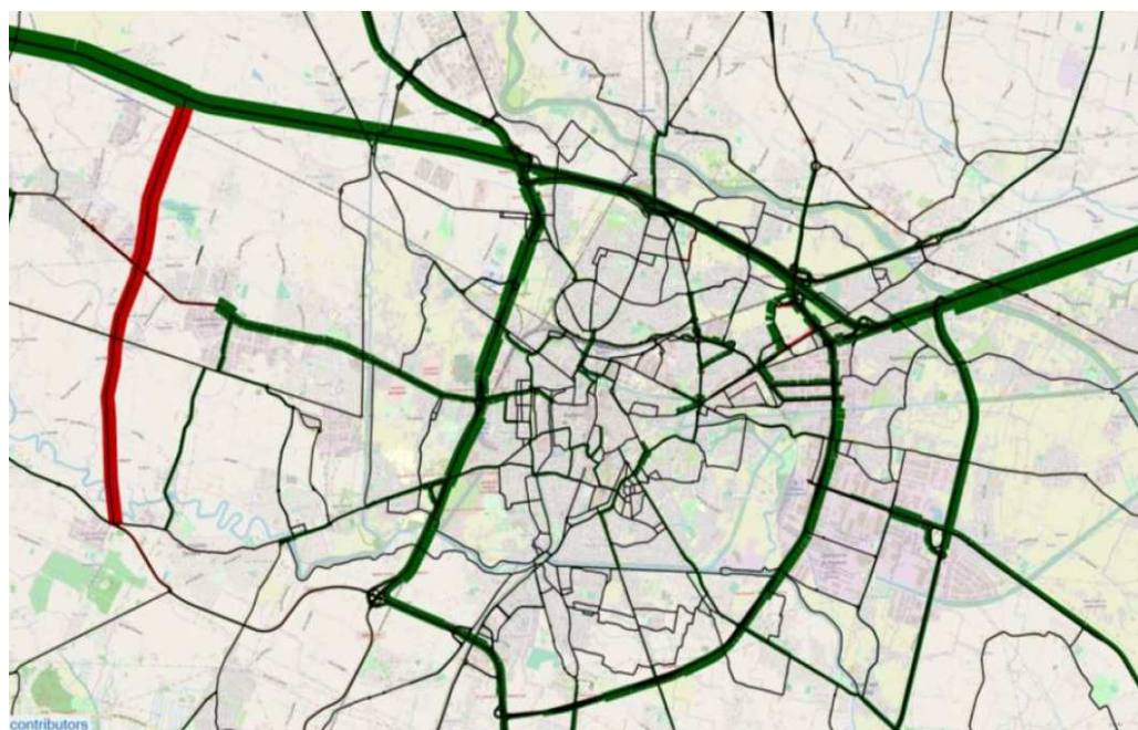
Variazioni nei flussi di traffico al 2030 tra scenario tendenziale e scenario di Piano (in rosso gli aumenti e in verde le riduzioni)

Si tratta come è facile immaginare di uno scenario piuttosto ambizioso, fondato su: